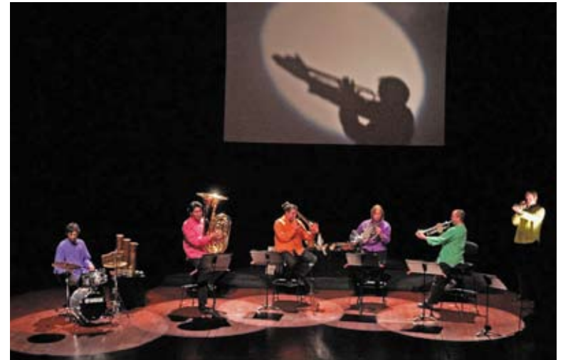
Uno de los conciertos en el Gran Teatro

Con la producción 'El Metal y sus colores', los conciertos hicieron un recorrido por distintas músicas especialmente compuestas para instrumentos de metal de una orquesta, con el objetivo de introducir al público infantil y juvenil en el mundo de la música desde una perspectiva lúdica y didáctica.