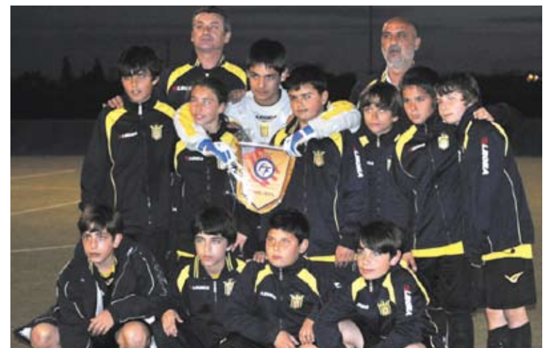
Equipo alevín tras clasificarse en la Copa Federación

Por otro lado, el equipo alevín de la UD se clasificó para la Copa Federación y quedó entre los 48 mejores equipos de la Comunidad Valenciana. Hay más de 550 equipos en la Comunidad y demostraron estar entre los mejores.