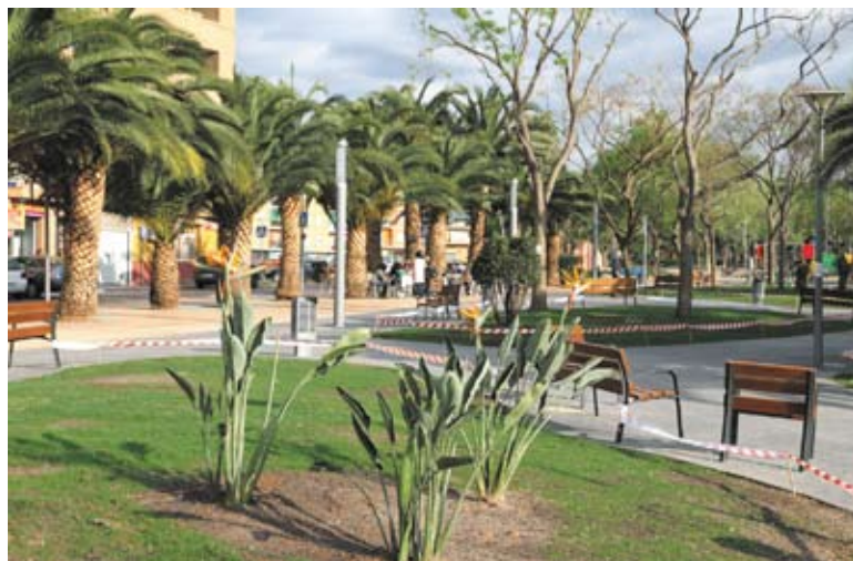
Parte de la zona finalizada frente a las cafeterías

El tercer tramo se configura como un jardín botánico en el que se crean seis parterres de familias vegetales: palmáceas, cactus, Quercus, plantas de interior, mediterráneo y cupresus. También se ha previsto la ejecución de un