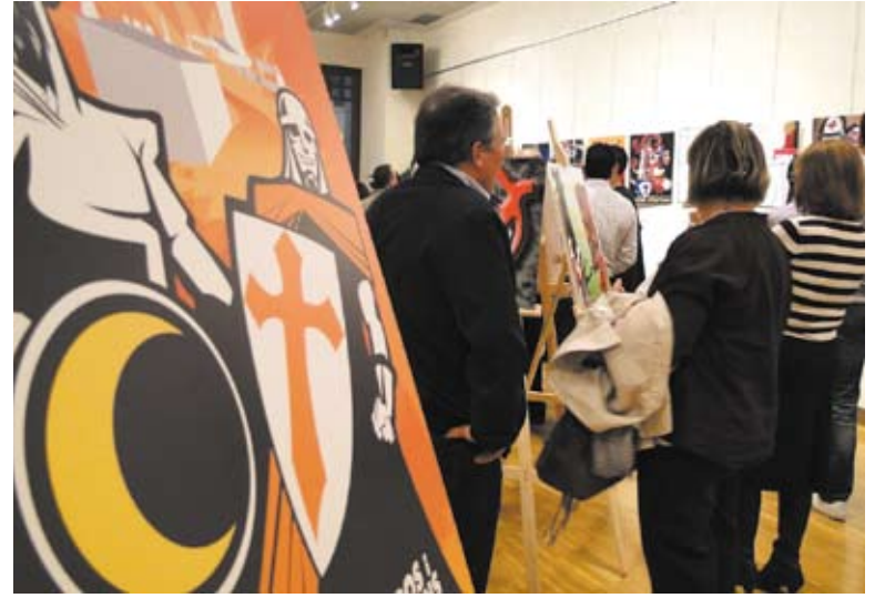
A.S. Algunos de los primeros visitantes ven las obras