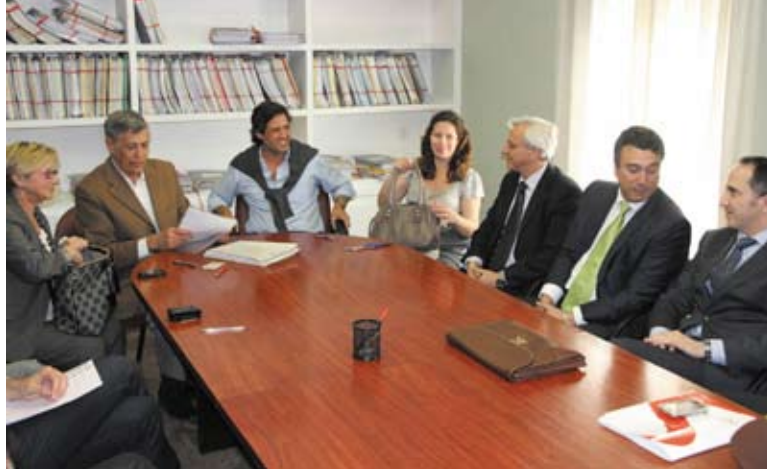
Momento de la firma para la creación de la empresa

En la memoria de creación de la empresa figura un Plan de Inversiones que contempla en los próximos 40 años la construcción de diez escuelas infantiles, tres centros de día, siete aparcamientos públicos, una residencia para