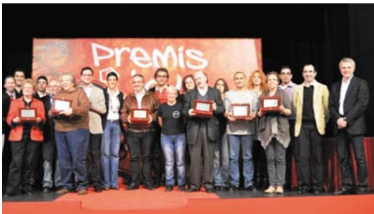
Foto de los premiados con representantes socialistas

Por último, en reconocimiento de su labor en defensa de la difusión de la vida y obra de Miguel Hernández, se premió a la asociación Orihuela 2M10