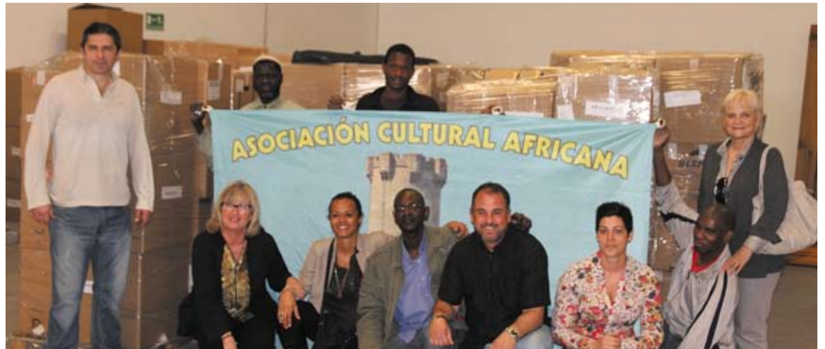
Representantes municipales y de la asociación Paterna te de la Mano con el material enviado

Para lograr este objetivo se han volcado distintos colectivos como de la Federación de Intercomparsas (material informático), Unión Deportiva Paterna (equipaciones deportivas), Gestión y Servicios de Paterna (ropa), Colegio Antonio Ferrandis (material escolar), Colegio Mayor La Coma, Servicio de Planificación Familiar (material sanitario), Universidad de Valencia (92 ordenadores), Casa Don Bosco (ropa y equipaciones deportivas), pollos Planes (35 ordenadores y 14 sillas), Centro Penitenciario de Picassent (40 pupitres), Construcciones Metálicas PAU (material de construcción).