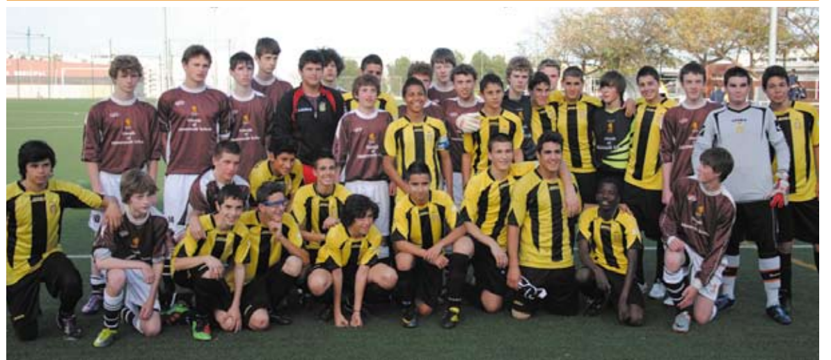
El equipo cadete con los jugadores de Gales