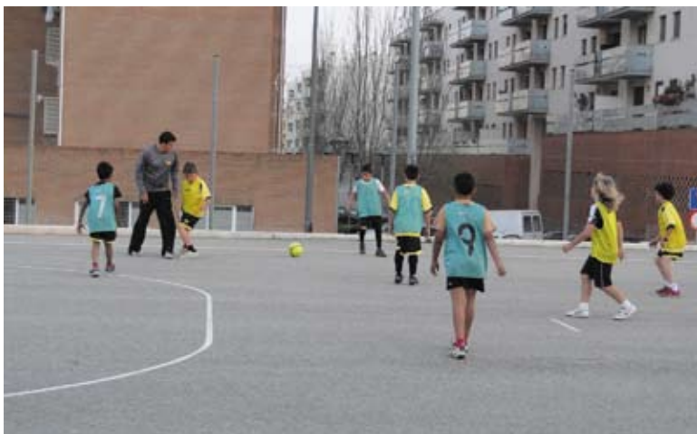
Uno de los entrenamientos del equipo de La Coma