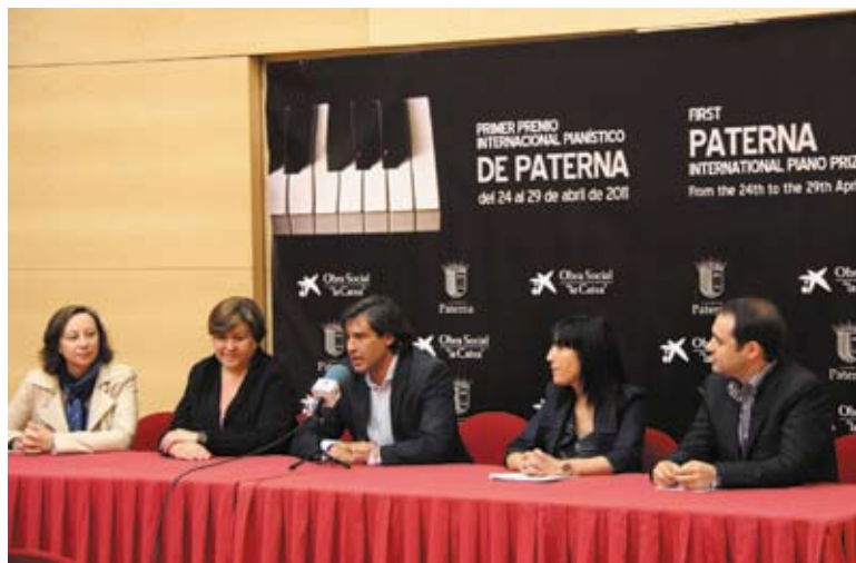
Presentación del concurso en rueda de prensa

Entre ellos hay muchos pianistas reconocidos que han conquistado otros premios de renombre como el Reina Elisabeth de Bruselas o el Takamatsu (Japón). Contar con ellos supone todo un lujo para esta primera edición del Premio Internacional Pianístico de Paterna.