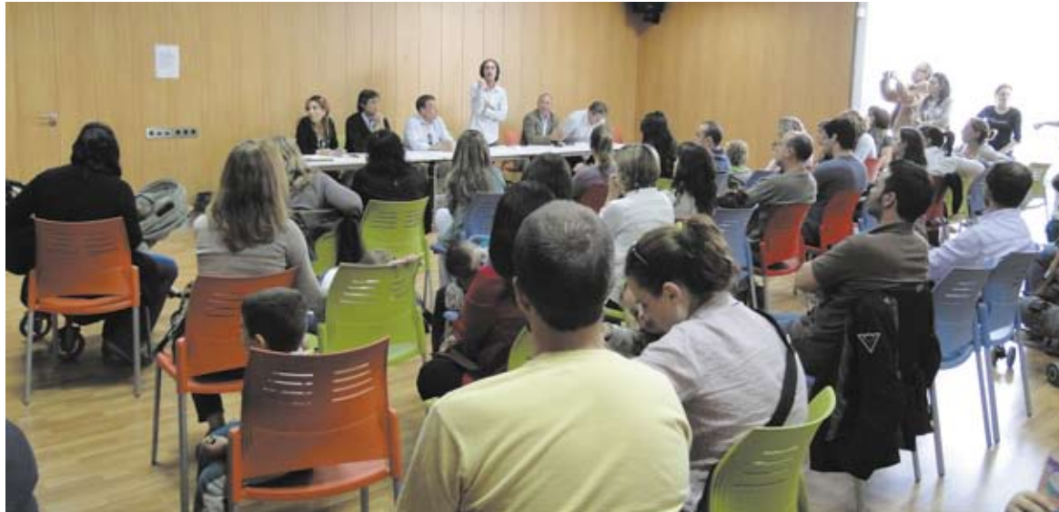
Medio centenar de vecinos acudió a la reunión informativa en el centro social

Durante la reunión que mantuvieron con el alcalde y otros representantes municipales, los padres de los niños mostraron su preocupación por el cambio de matriculación desde el Jaime I, ya que muchos de los vecinos de Lloma Llarga van allí y no sabían donde tenían que formalizar la matrícula. También les preocupa el plazo de finalización de las obras, ya que en sólo cuatro meses tiene que construirse toda una