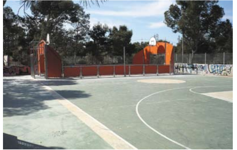
Imagen de la cancha sobre la pista de baloncesto

Recientemente, el tema fue tratado de nuevo en una reunión vecinal y se propusieron ubicaciones alternativas en el barrio. Sin embargo, desde el consistorio, el