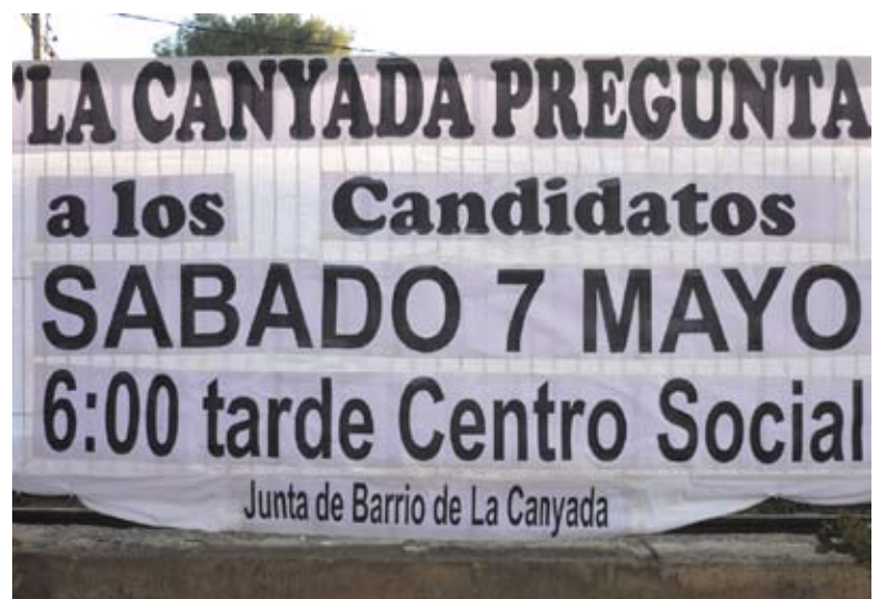
Pancarta colocada junto a las vías del metro

Entre las preguntas, también les plantean las medidas de choque que adoptarían en los cien primeros días si llegaran a gobernar.