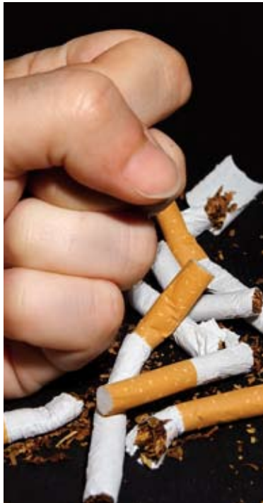
La voluntad es muy importante PAD

1. Dígaselo a su familia, amigos y compañeros de trabajo: "Voy a dejar de fumar". Busque comprensión y apoyo en ellos. Si su pareja también fuma, animele a dejarlo al mismo tiempo.