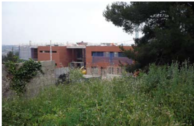
Actual acceso al instituto por la calle 8

Con estas obras, que llevará a cabo la Sociedad Urbanística Municipal (SUMPA), se intentará dar solución a los problemas de comunicación y tráfico que se han detectado desde que ha entrado en