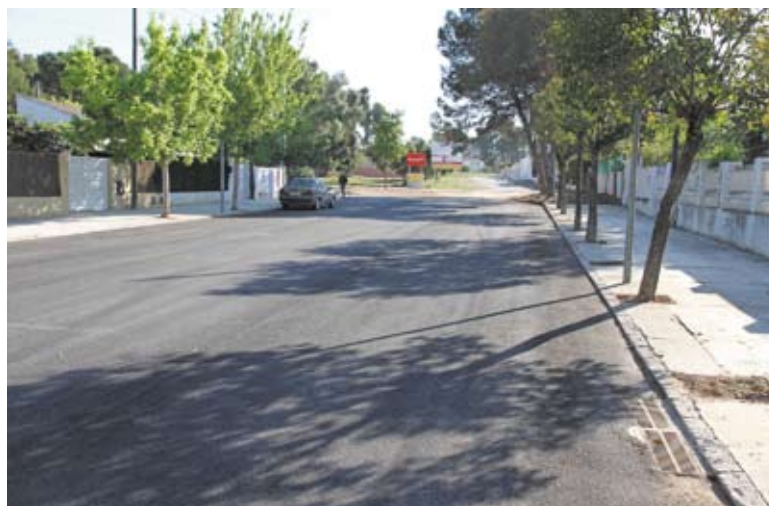
Así ha quedado el barranco de Serra