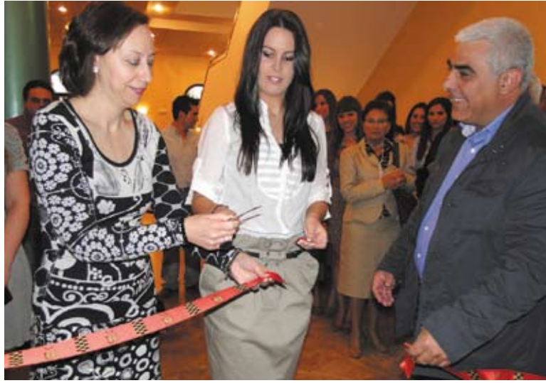
Momento de la inauguración de la exposición