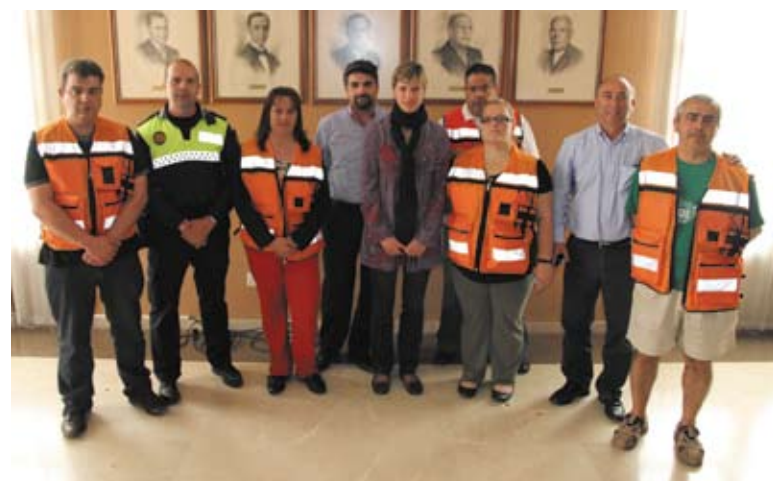
Miembros de Protección Civil y Policía con autoridades PAD

El PSOE ya retiró una pancarta que colgaba de un edificio de la calle Ramón Ramià Querol y la Junta Electoral ha instado a todas las formaciones a que retiren los carteles de las zonas. Asimismo, la Junta Electoral no ha admitido las alegaciones que efectuaron desde el PSOE ni desde el Centro Democrático Liberal de Paterna.