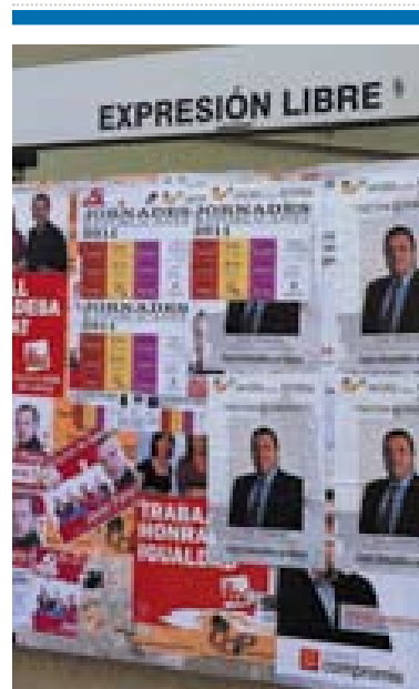
Algunos carteles electorales PAD

Un Plan de Emergencias debe instaurar los protocolos necesarios para que todos los sectores que deben participar en estas situaciones sepan como actuar, algo que incluye tanto a las Administraciones Públicas como a las empresas privadas y a la ciudadanía.