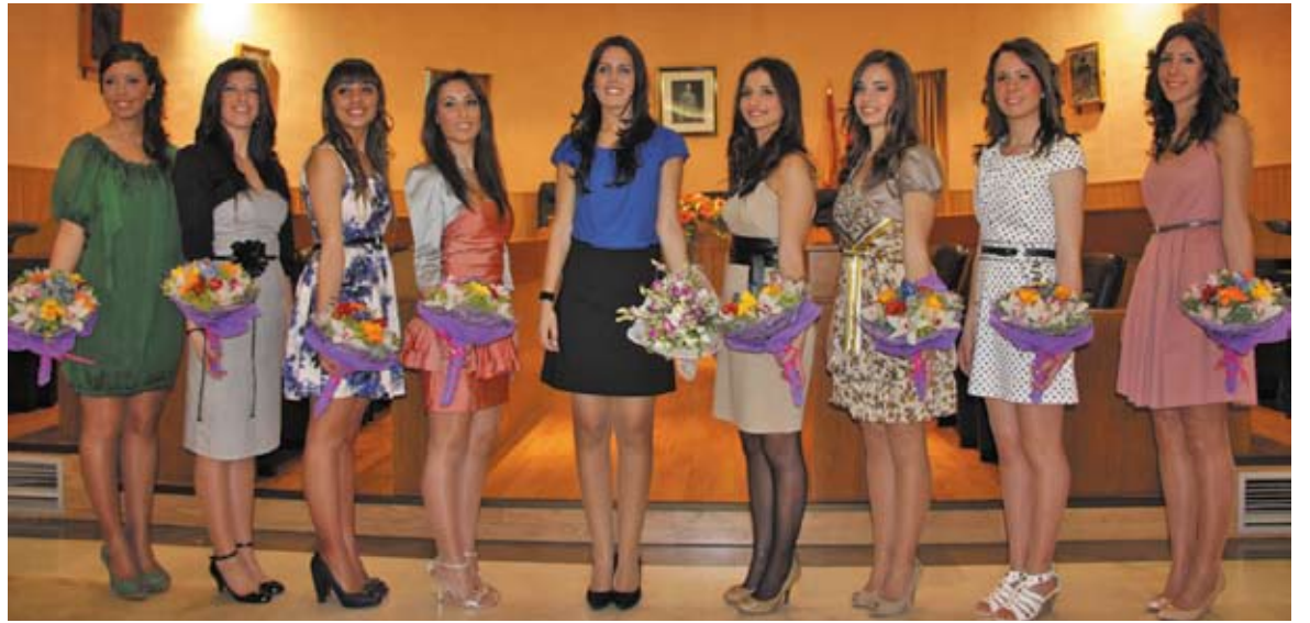
La Reina de 2011, junto a su Corte de Honor