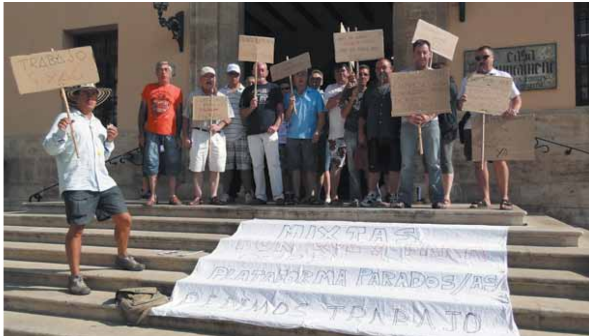
Una docena de parados del municipio manifestándose en la puerta del Ayuntamiento

El PSPV ha echado en cara al equipo de gobierno que desde el pasado 1 de junio cuando se aprobó en Junta de Gobierno Local la rescisión del contrato no han vuelto a tener más información al respecto y tampoco se ha convocado una comisión de investigación como pidieron. Fuentes municipales han asegurado que el tema está en el Consejo Jurídico Consultivo, que FCC ha presentado alegaciones, así como el Ayuntamiento. Hasta que haya un resultado definitivo FCC se seguirá encargando de la limpieza viaria.