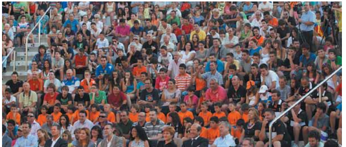
La Cova Gran se llenó de aficionados que animaron al nuevo jugador