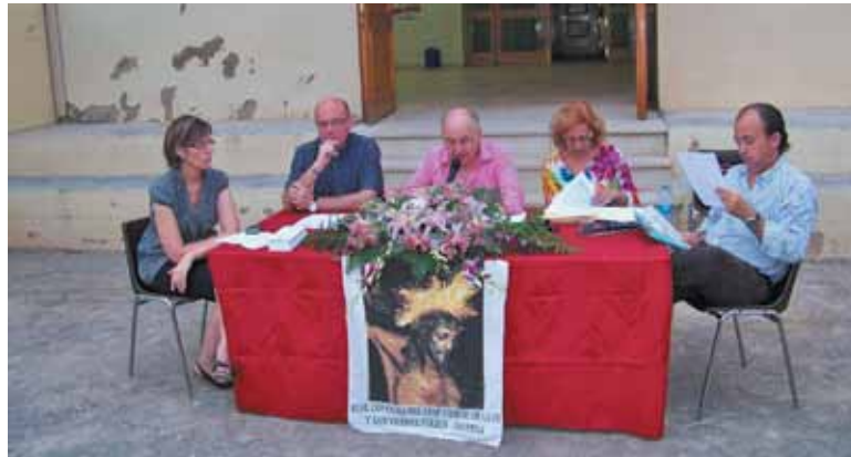
Presentación de la web en el Centro Parroquial

La web se compone de varias secciones donde los visitantes podrán ver los datos oficiales tales como Junta Directiva, contacto, boletín, situación económica, etc.