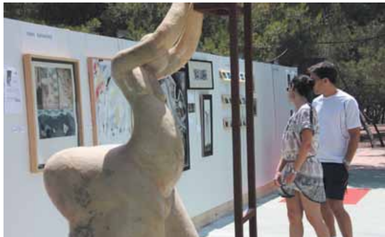
Una pareja visitando la exposición

El buen tiempo de los primeros días no aguantó hasta el final y