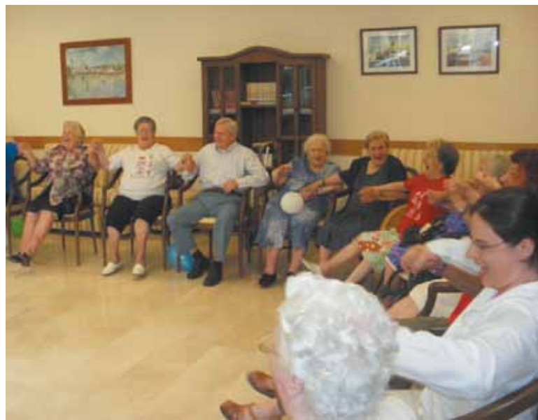
Uno de los divertidos momentos del taller de risoterapia

La apuesta por actividades complementarias a los fármacos es uno de los objetivos en los que trabaja de forma continua el equipo multidisciplinar del grupo Ballesol: actividades basadas en el método montessori, visionado de documentales para trabajar la