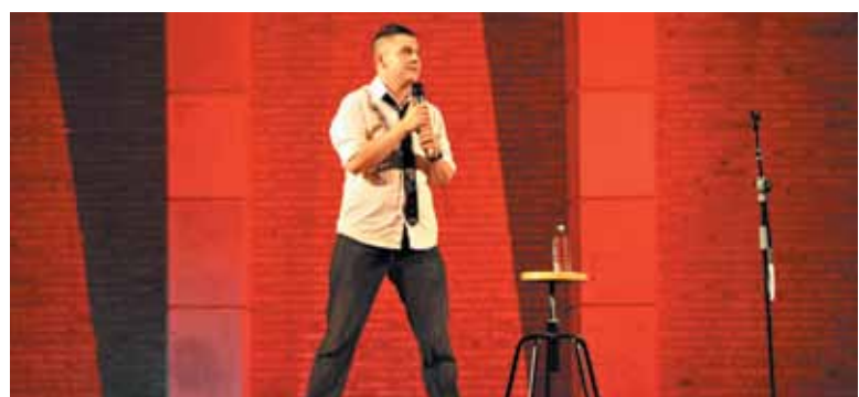
Los monólogos llenaron la Cova Gran