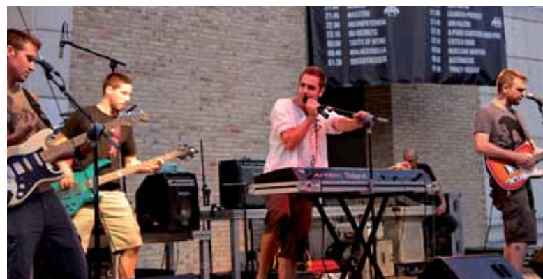
Concierto de Cadem Project en el Socarrocks 2011

Del 1 al 6 de agosto. Inscripciones hasta el 21 de julio Info: Casa de la Juventud