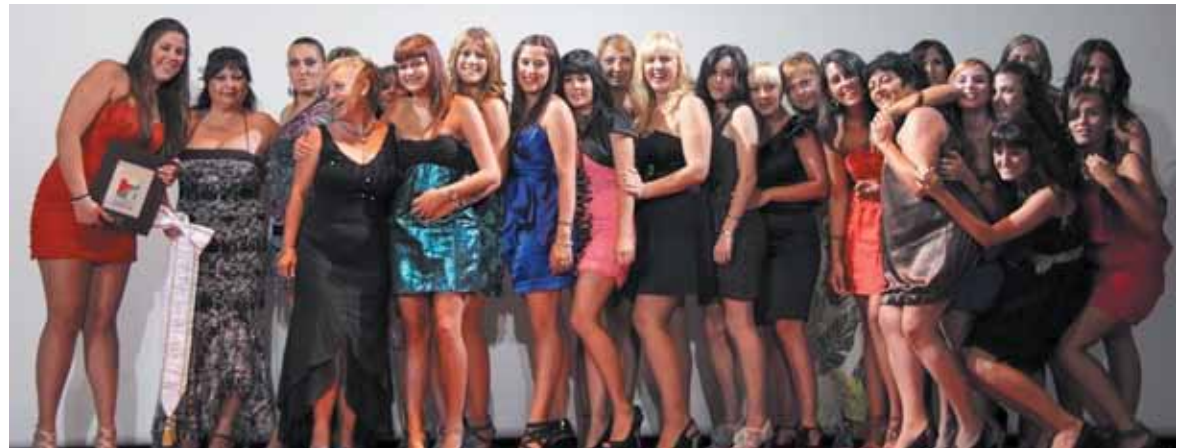
Las Zíngaras volvieron a triunfar en el bando moro por tercer año consecutivo