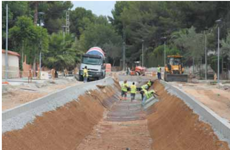
Trabajadores realizando sus labores en el barranco Barato PAD

La obra original que actualmente está en su fase final supone la instalación de un canal a cielo