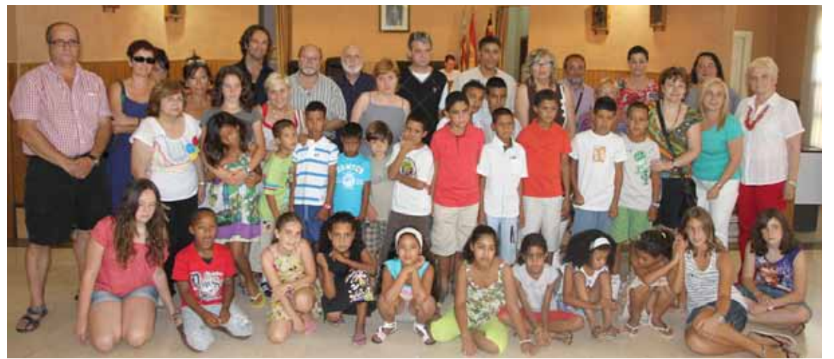
Los niños saharauis con sus familias de acogida y las autoridades

El auditorio ha servido como escenario para la grabación de un videoclip del grupo patenero Automatic. Los jóvenes músicos, que pertenecen a la asociación de grupos locales Paterna en directo, consideran todo un privilegio poder utilizar estas instalaciones que se abrieron el año pasado como espacio central de su videoclip "El principio del final". La banda patenera ha destacado que pensaron en el auditorio como escenario "por la buena calidad de las instalaciones". El video se puede ver a través de las páginas web facebook.com/automaticband o en myspace.com/automatics. Como curiosidad, la mayoría de las personas que aparecen en las imágenes son de Paterna.