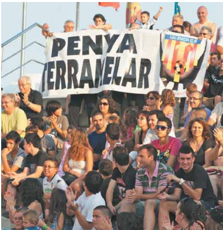
La Peña de Terramelar no faltó a la cita con su club