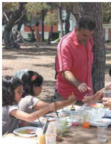
Taller de pintura