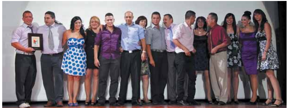
Los Piratas recogiendo su premio a mejor comparsa 2010