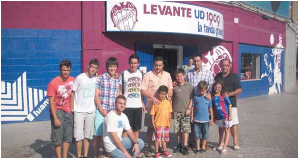
Miembros de la nueva peña del barrio de Lloma Llarga