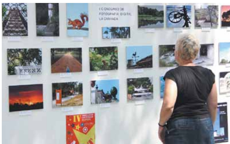
Se expusieron las 25 mejores imágenes del concurso de fotografía

Un año más el público participante ha valorado como un privilegio tanto el entorno de las jornadas en la Pinada de La Canyada como el nivel de las actividades y participantes de las mismas.