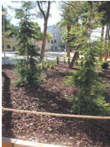
Una parte del jardín PAD

346.000 euros con cargo a los Presupuestos Participativos y se desarrolla en coordinación desde la brigada municipal y la empresa municipal de servicios.