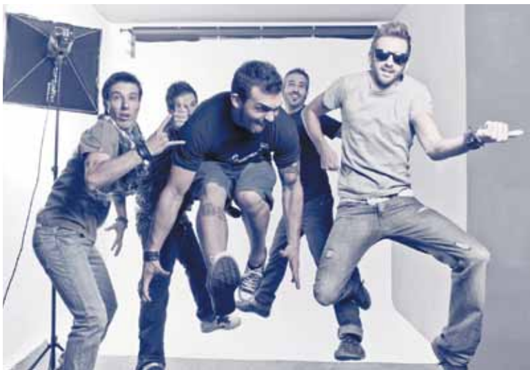
Componentes del grupo patenero Rey Gudú

El festival llevará a Burriana a artistas de la talla de Scissor Sisters, Rinôçérôse, Tiga, Russian Red o Vetusta Morla y ya hay ventas más de 20.000 localidades