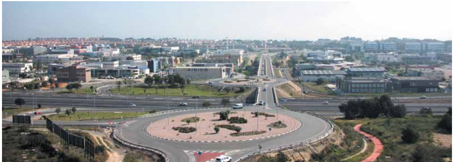
Imagen del Parque Tecnológico de Paterna

Por ello, entre las prioridades del nuevo concejal de Hacienda y Empresa está disminuir los gastos