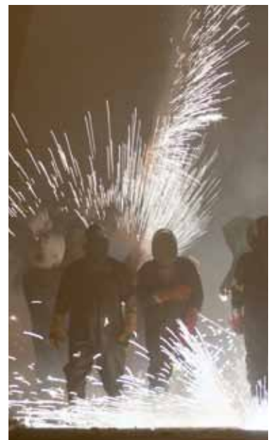
La Cordà de Paterna

El acto para los niños será el 24 de agosto en el coheteródromo a las once de la noche y previamente los participantes deberán formarse en la 'Escoleta del foc' los días 21 y 22 de agosto. Más información en la página web www.interpenyespaterna.org .