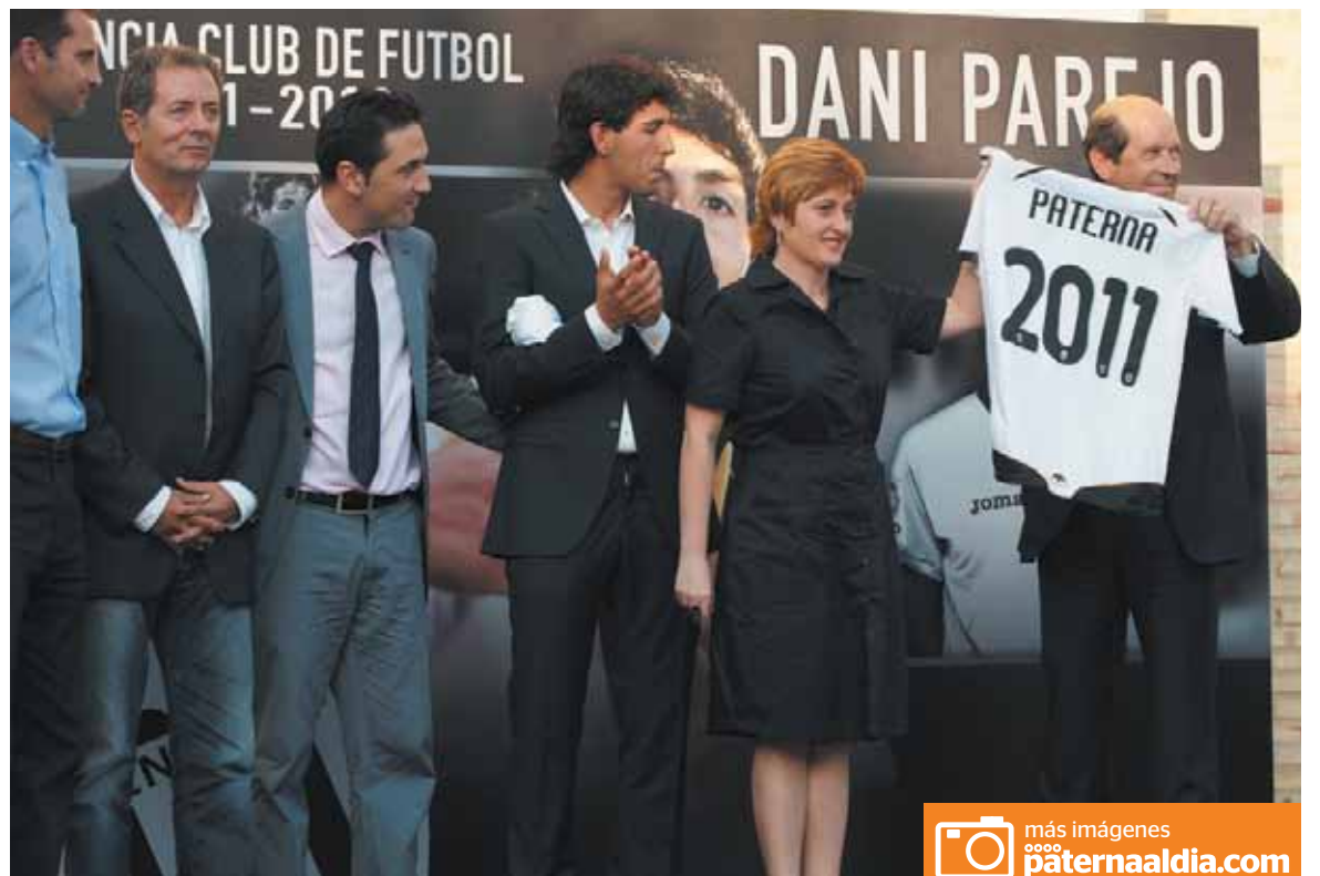
El presidente del Valencia C.F. entregó al municipio una camiseta donde se leía 'Paterna 2011'