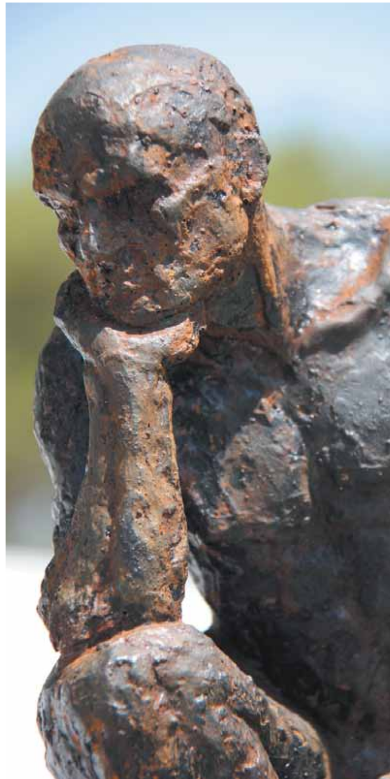
Una escultura pensativa en medio de la Pinada