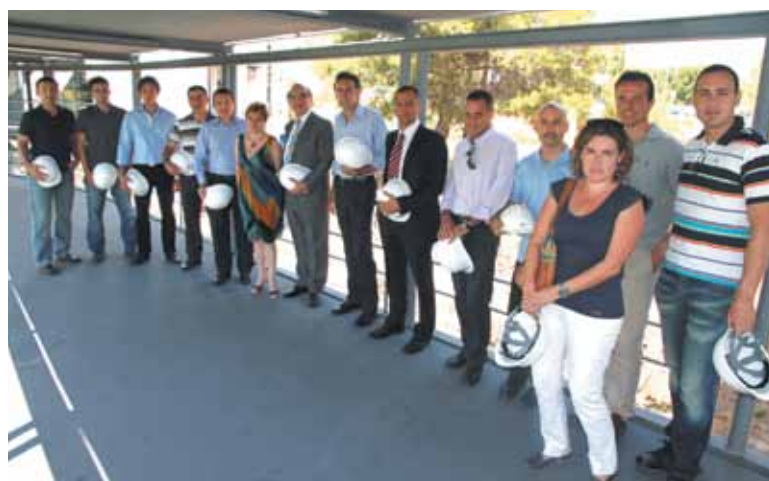
Foto de la visita al Instituto Tecnológico del Plástico (AIMPLAS)

El plazo de ejecución de las obras es de 10 meses y supone una inversión de 3,6 millones de euros cofinanciados por el Fondo Europeo de Desarrollo Regional (FEDER) y el Instituto de la Mediana y Pequeña Industria Valenciana (IMPIVA). Las nuevas instalaciones permitirán ampliar la plantilla alrededor de un 20% llegando a las 130 personas contratadas.