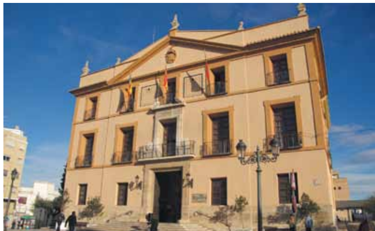
Imagen del Ayuntamiento de Paterna

La reordenación del personal se hará a través de la aprobación de la nueva Relación de Puestos de Trabajo que irá al pleno del mes