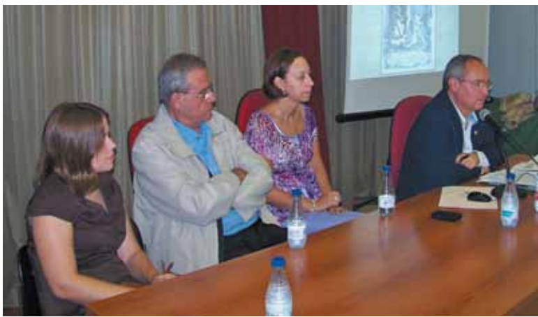
Imagen de la conferencia en el teatro Capri

Segura indicó que el Cristo de la Fe es otro de los símbolos que distingue a los paterneros y que, junto a la Torre, es la referencia que de normal nombran cuando se les pregunta sobre su ciudad.