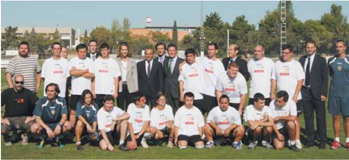
La infanta Elena con directivos del Valencia y componentes de la escuela de fútbol adaptado Lázaro de la Peña