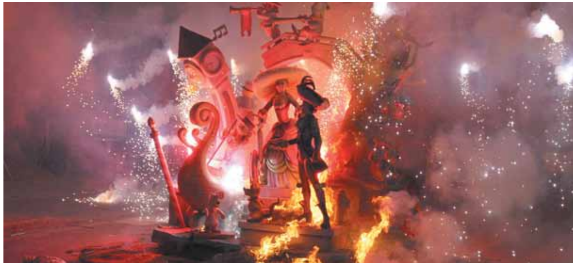
Falla municipal infantil de 2011 durante la Cremà

Todavía hay pendiente una reunión entre el alcalde y representantes de la Junta Local para ver cómo serán los recortes y detallar el tema del monumento municipal, pero desde el organismo fallero no se resisten a quedarse sin falla y están decididos a buscar otras soluciones que puedan ser más económicas, aunque no han querido avanzar más detalles hasta que no se les informe con detalle sobre los recortes.