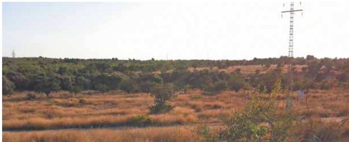
Terrenos frente a Heron City donde podría instalarse el centro comercial inglés

El primer paso para la modificación del Plan General ha sido la aprobación del documento inicial para la evaluación ambiental, que ha salido adelante con los votos del Partido Popular, pero con el rechazo de la oposición PSOE, EU y Compromís, que consideran la actuación un pelotazo urbanístico.