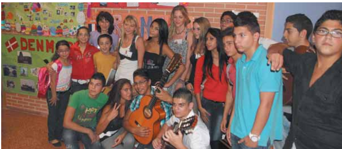
Alumnos de La Coma y de otros países europeos

Los ganadores de los mejores dibujos y fotografías de la V Semana de la Movilidad ya han recibido sus premios. Concejales de todos los grupos con representación municipal participaron en