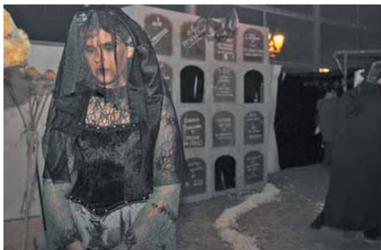
El terror llenará las calles de Paterna