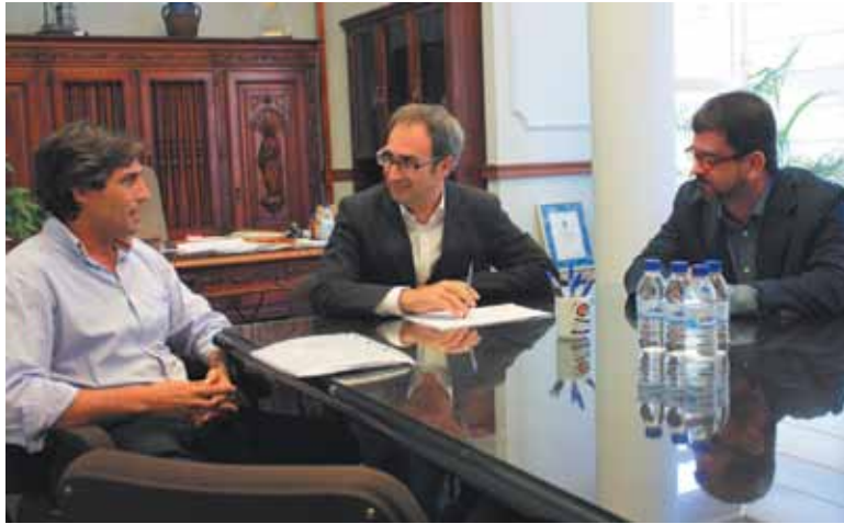
Imagen de la reunión entre los representantes

El uso de infraestructuras comunes con el objetivo de ganar en eficiencia es otra cuestión en la que existe voluntad de alcanzar acuerdos. En concreto la utilización conjunta de un mini ecoparque podría ser el primer punto de