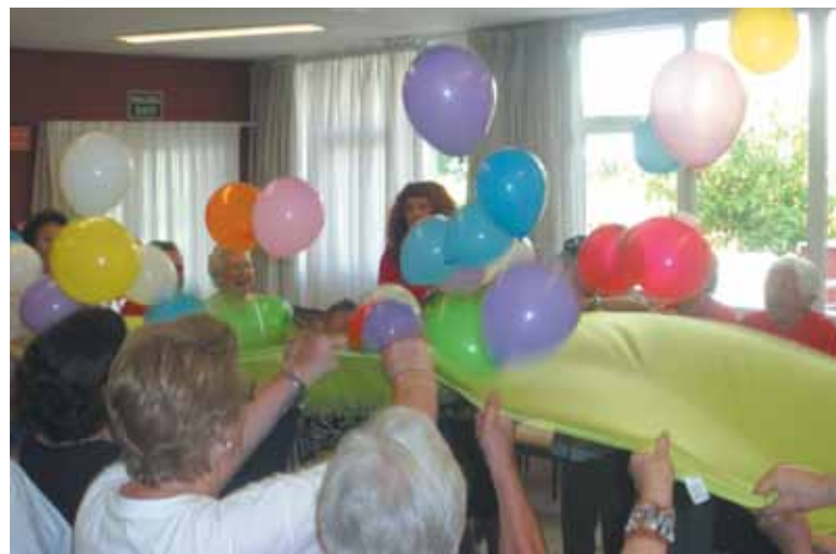
Un momento del taller de musicoterapia

Debido a su gran éxito y aceptación por aquellos residentes que