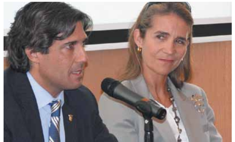
Agustí y Elena de Borbón

Minutos después manifestaba en su twitter "Que a gusto se queda uno al gritarle eso a un Borbón!". A través de su página web, el concejal consideró incomprensible que "esta señora venga supuestamente como representante de la Fundación Mapfre pero lo haga con todos los honores". "Es vergonzosa la actitud genuflexa de los representantes políticos de todos los grupos excepto EU ante