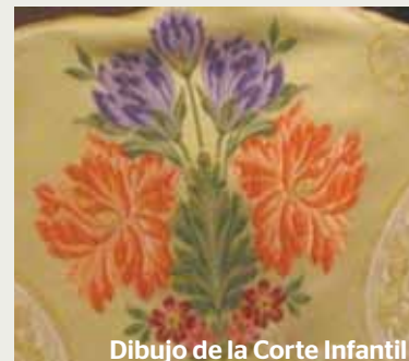
Dibujo de la Corte Infantil