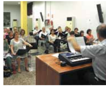
Imagen de un ensayo del coro PAD

El día 29 de octubre, a las 19 horas, l'Associació Coral de Paterna, con la colaboración del Ayuntamiento, ha programado un concierto que ofrecerá el Cor Harmonia y que tendrá lugar en el auditorio Antonio Cabeza. Director, cantantes y un reducido grupo instrumental ofrecerán una visión histórica y evolutiva del canto coral y su relación con las otras manifestaciones artísticas. La sesión será amenizada con la proyección de imágenes que estarán en consonancia con los temas interpretados.