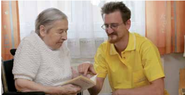
Una enferma durante el taller de lectura

Cada individuo puede experimentar una o más, por lo que si usted nota cualquiera, coménteselo a su médico. Además es necesario saber que el ejercicio de la memoria y la actividad intelectual, no tiene por qué ser proporcional al nivel de educación o cultural de la persona y que en muchos casos, se recomienda a los pacientes realizarlos.