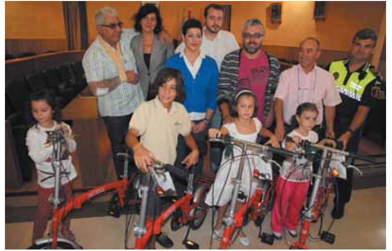
Los estudiantes recibieron una bicicleta