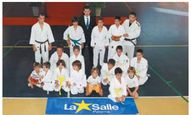
Miembros del equipo de judo C.A.A.