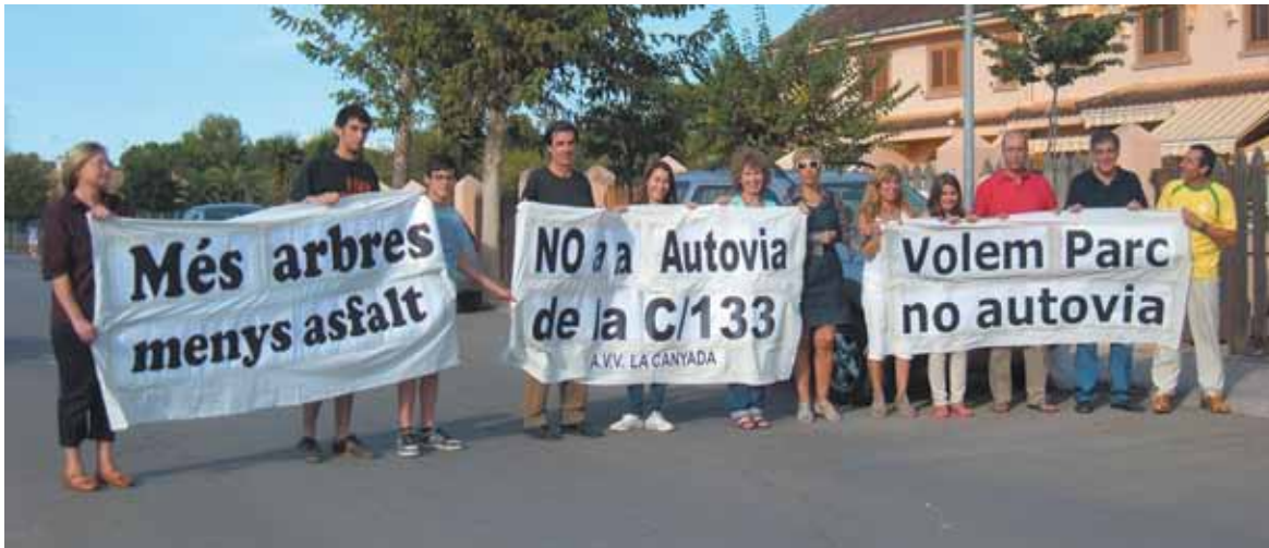
Vecinos con pancartas en contra del proyecto de convertir la calle 133 en un eje prioritario

El concejal de Obras se compromete a estudiar una reducción del ancho de la calzada y a escuchar las propuestas