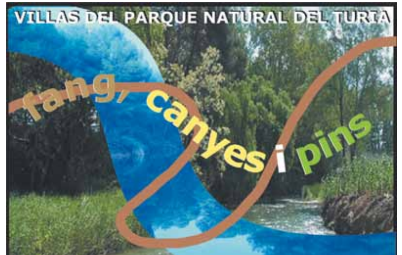
Detalle del cartel de la jornada medioambiental y cultural

Aquí los responsables del Parque Natural de Turia hablarán