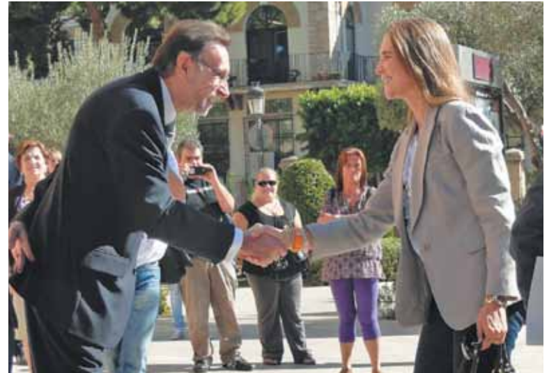
El concejal de Deportes saludando a la infanta