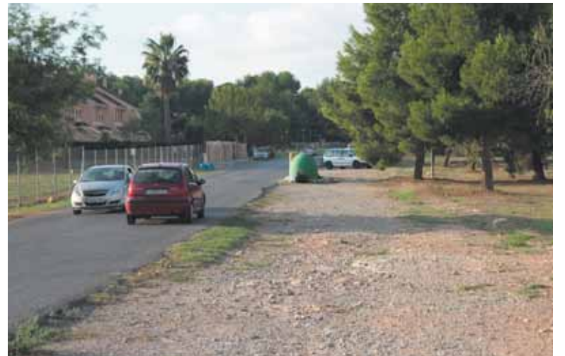
Imagen de la calle 133