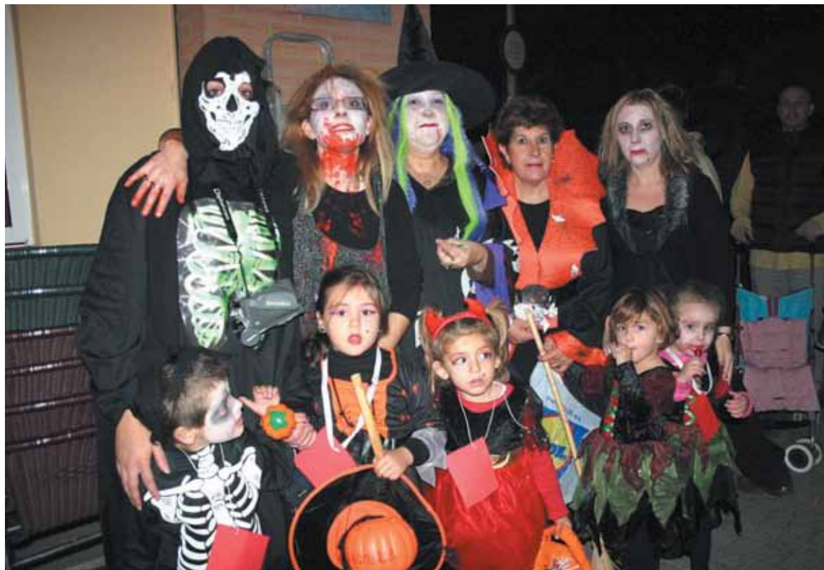
Niños y mayores disfrazados en otra edición de la fiesta de Halloween

La Asociación de Comercio y profesionales, Paterna Unió de Comerç (PUC), con la colaboración de Lloc de Jocs tienda de