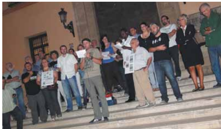
Lectura del manifiesto fundacional frente al Ayuntamiento

Asamblea Paterna 15M, Esquerri Unida, PSOE, Compromís, Equo, PCE, CCOO, UGT, CGT, Intersindical Valenciana, Plataforma de Parados, Juventudes Socialistas, Ciudad de Trabajadores, Joves amb Iniciativa, Joves d'Esquerri Unida y el Ateneo Republicano, son algunas de las organizaciones y colectivos que han impulsado la iniciativa.