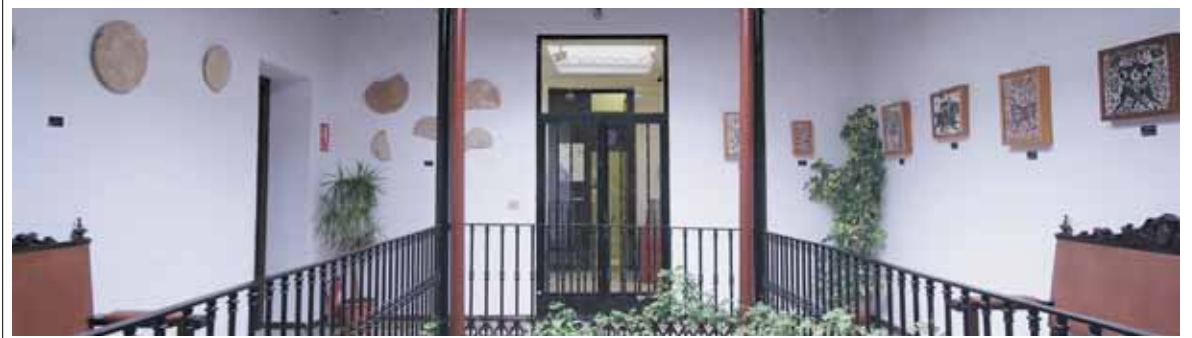
Museo de cerámica de Paterna, desde donde partirá la marcha

La inscripción es gratuita, con un límite de 60 plazas. Para la inscripción es necesario enviar un correo electrónico a didacticamuseo@ayto-paterna.es , indicando nombre, apellidos, edad, NIF, mail y teléfono de contacto.