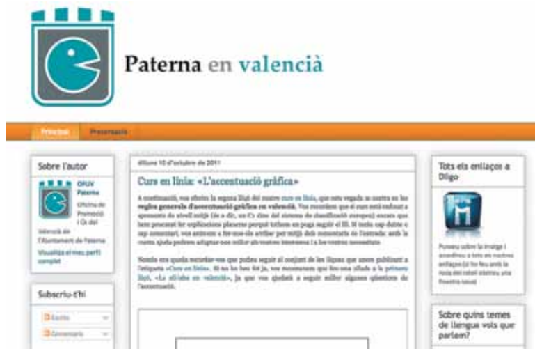
Imagen de la página de inicio del blog de la Oficina del Valenciano PAD

La iniciativa responde a dos objetivos principalmente. Por una parte, pretende aumentar la difusión de las actividades de la oficina dentro del municipio y, por otra, ayudar a los paterneros a conocer y usar los recursos lingüísticos en línea para que puedan mejorar su competencia en valenciano: diccionarios, traductores, exámenes oficiales, consejos sobre lengua y gramática, recursos de autoaprendizaje, derechos lingüísticos, recopilación