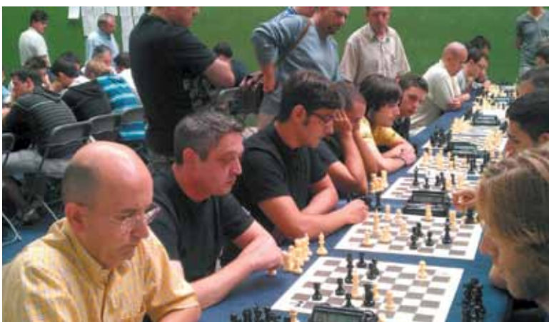
Miembros del club patenero durante la competición

El torneo se celebró en Chestre y participaron tanto el equipo A como el B del club patenero.