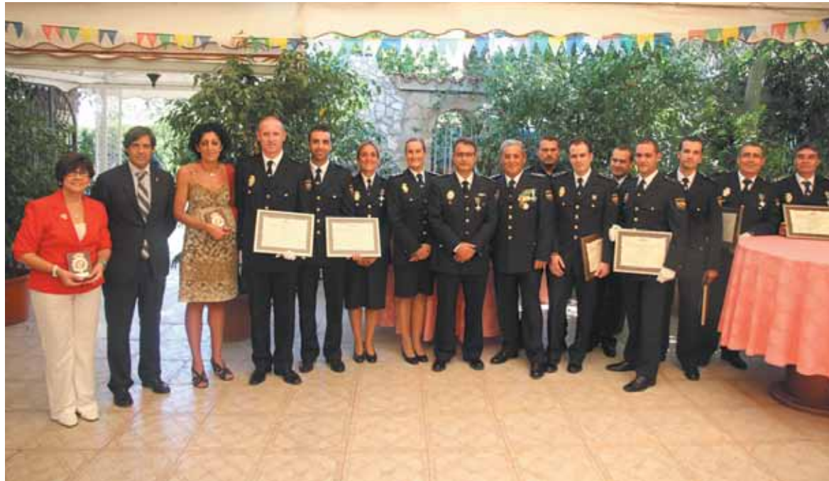
Los galardonados, junto a las autoridades