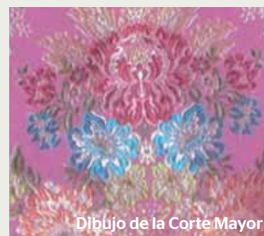
Dibujo de la Corte Mayor