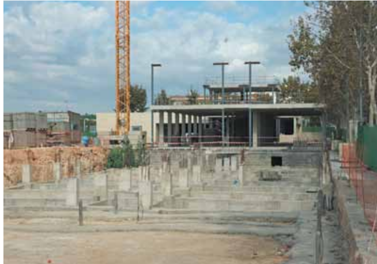
La obra de la segunda fase, en proceso de cimentación

El Centro Democrático Liberal, que ha alertado de los hechos, ha pedido explicaciones al consistorio sobre las causas de este parón, así como la fecha en la que se piensan retomar las obras. El CDL también ha destacado que