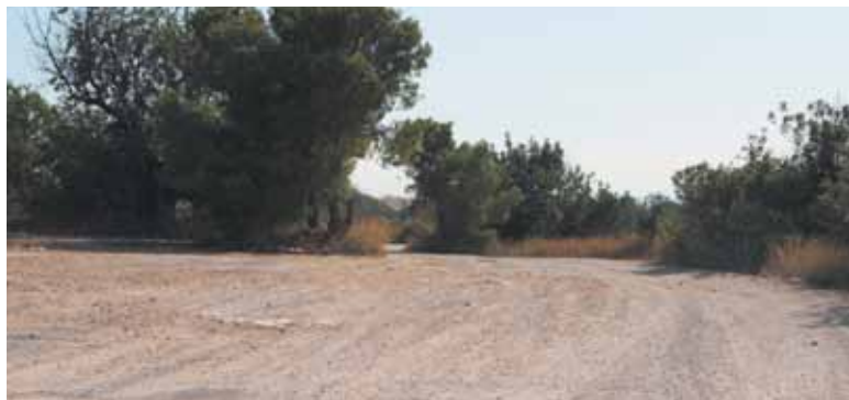
Imagen del camino que será asfaltado

Pese a no estar asfaltado se había convertido en un camino que cada vez contaba con mayor uso, lo que justifica su adecuación. Concretamente supone la conexión desde el camino del Rabossar con la rotonda que rinde homenaje al ex presidente de los empresarios de La Andana, José Cabañero. La actuación comprende el asfaltado de 1.746 m 2 .