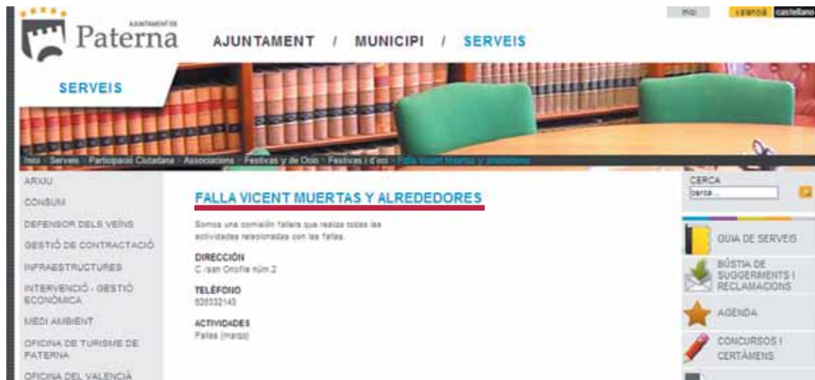
Captura de pantalla de la web municipal con el nombre erróneo de la falla Vicent Mortes