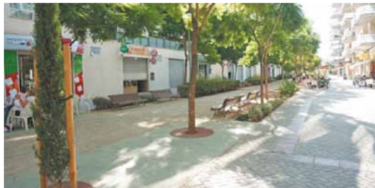
Parte sin setos al principio del paseo

La principal calle peatonal y comercial que hay en el barrio está dividida por unos setos bajos que hacen de medianera entre la zona ventral y los laterales, pero hace un par de meses y, tras peticiones vecinales, el Ayuntamiento quitó los setos del primer tramo de calle para que los vecinos vieran cómo quedaba y ampliar así la zona de paseo y terraza de los bares.