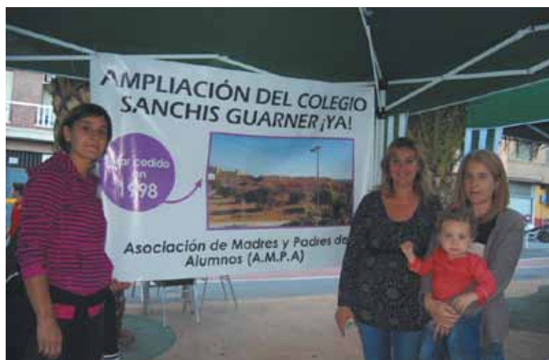
El AMPA del Sanchis Guarnier reclamó la ampliación del centro

Este espacio tradicional de intercambio de experiencias volvió a reunir a centenares de personas en el céntrico barrio, en el que pudieron conocer nuevas técnicas para hacer más felices a sus mascotas con las charlas de 'La perrita valiente', jugar al fútbol del Centro de Menores o estrechar