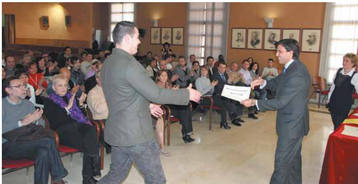
Entrega de los cheques de ayuda del Ayuntamiento del año pasado

En el plano formativo, Palma ha destacado las charlas que desde principios de año se han