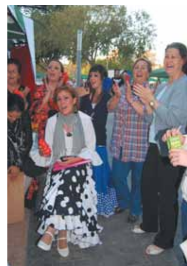
La asamblea 15-M de Paterna animó a la lucha social y organizó un mercado del trueque. A la derecha, las sevillanas del Centro Cultural Andaluz, que animaron la fiesta