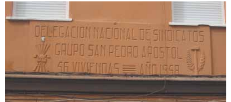
Placas con el yugo y las flechas en una fachada de una finca

La propuesta presentada a instancias de la asociación republicana se aprobó el 28 de marzo con el objetivo de que se cumpliera el artículo 15 de la Ley de Memoria Histórica. El Ateneo entregó en su momento al Ayuntamiento un dossier en el que se registraban, calle a calle, las 343 placas falangistas todavía presentes en el término municipal. Las placas contienen el yugo y las flechas, símbolo de la falange y del fascismo en la España de la dictadura. Desde el Ayuntamiento aseguran que están a la espera de que llegue una subvención para que no suponga ningún coste a los vecinos.