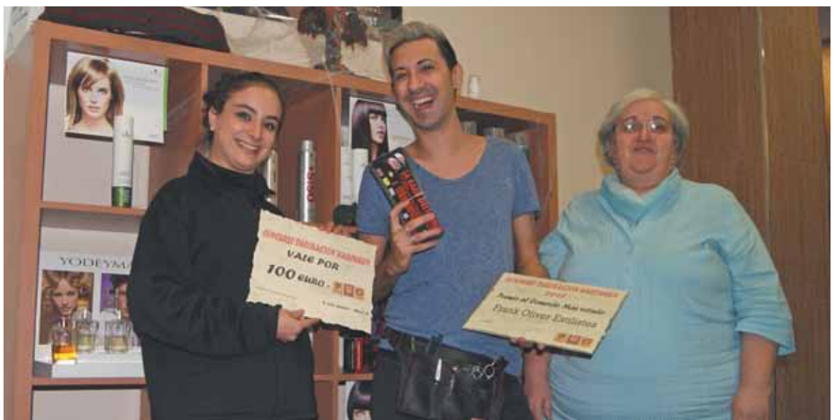
La secretaria y la presidenta de PUC entregando el cheque regalo de 100 euros

Los únicos requisitos para participar en el concurso, eran tener un comercio en la localidad de Paterna y decorar, el espacio que ellos desearan, con la temática de Halloween. Desde Paterna Unió de Comerç, han mostrado su gran satisfacción por la acogida que ha tenido la campaña, por parte de los comerciantes y visitantes.