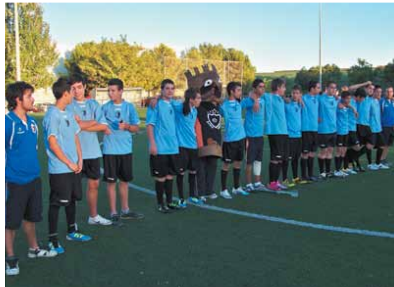
Dos de los equipos del Avant, el día de la presentación de la nueva temporada del club