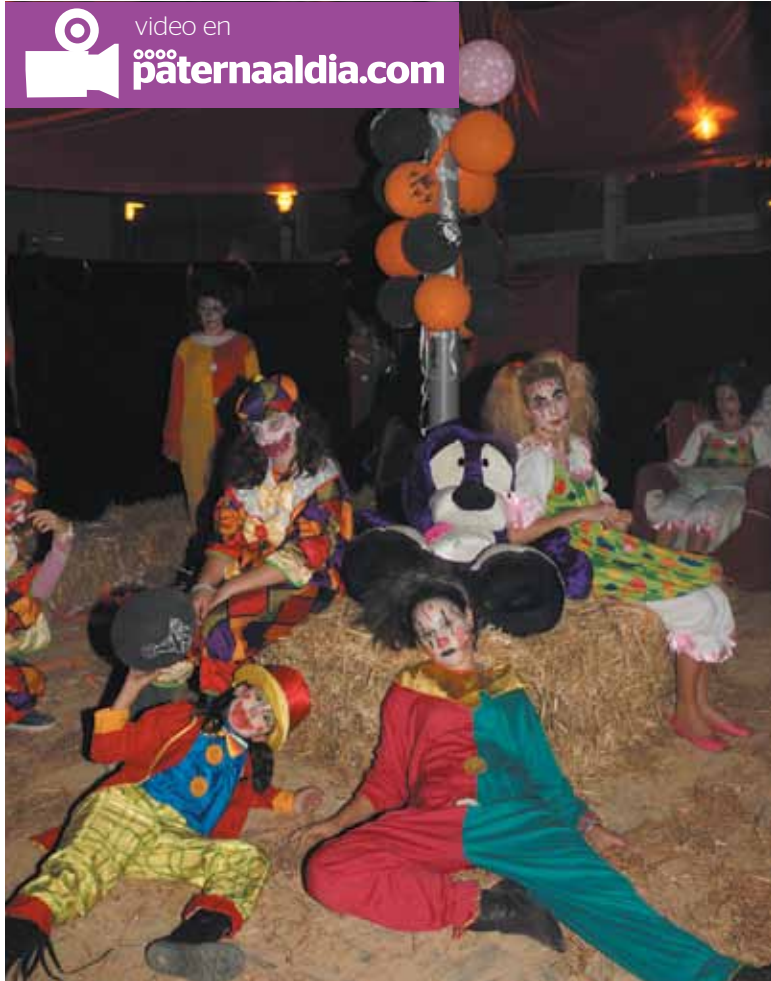
En el coheteródromo del terror sorprendieron los payasos muertos PAD