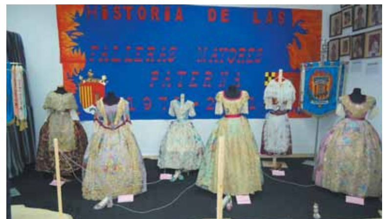
Muestra de trajes de Falleras Mayores de Paterna

Actos como este hacen demostrar que las fallas llevan muchos años siendo parte de la historia de Paterna y mientras quede un fallero nunca se apagará la llama.