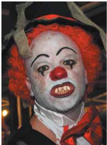
Un siniestro vampiro PAD