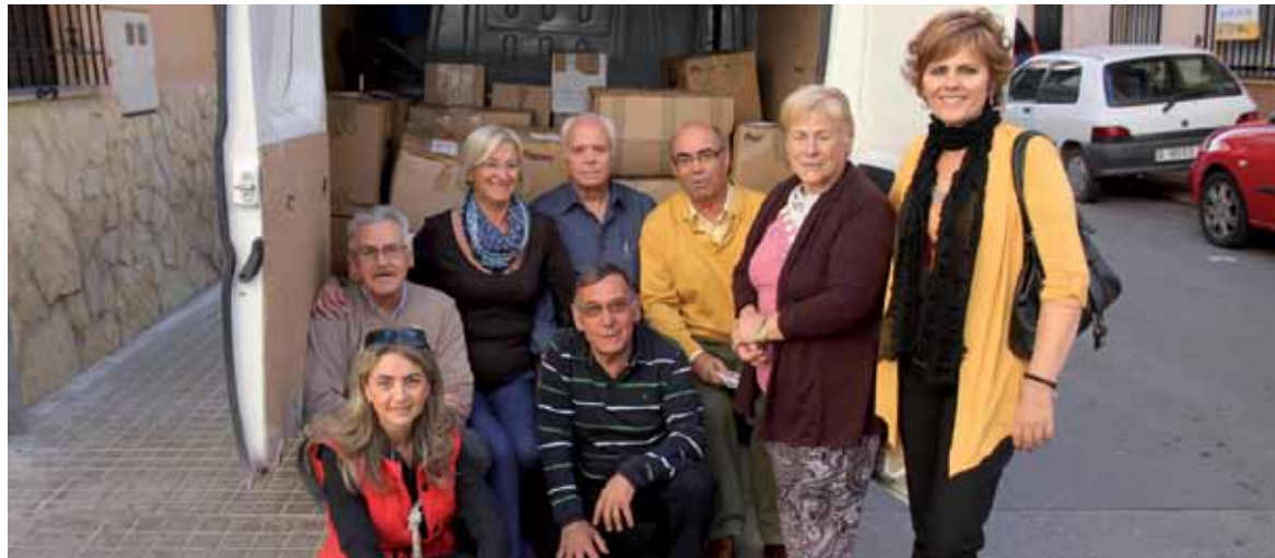
Representantes del Hogar del Jubilado de Campamento, junto a la concejala del Mayor

Han recolectado 1.200 kilos de comida no perecedera para la entidad