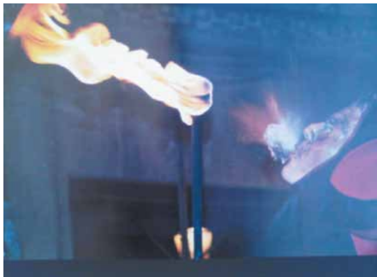
Imagen ganadora del primer premio

En total se han presentado 47 fotografías al concurso y las obras seleccionadas se pudieron ver en una exposición en los comercios de la calle Mayor del 7 al 22 de octubre.