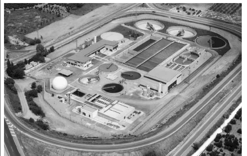
Imagen de la EDAR de Paterna PAD

Las empresas del sector agroalimentario son las que más se pueden aprovechar de este beneficio, ya que son las que generan como