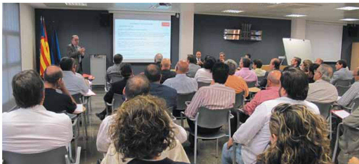
Presentación de la central de compras en la sede de Asivalco

En tiempos de crisis, se ha pensado que la unión y la negociación conjunta es la mejor manera de poder mejorar la competitividad y ahorrar costes en suministros como telefonía, electricidad,