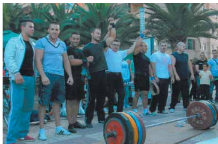
La halterofilia también estuvo presente

Ya por la tarde, los protagonistas fueron el Grupo Scout Alborxí La Salle con su muestra de danzas, el Grupo Espeleológico Proteus con su exhibición de escalada