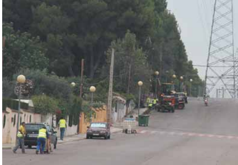
Operarios trabajando en la parte lateral de la calle 238

Respecto al primer problema planteado se modificó el proyecto eliminando el aparcamiento en cordón en el lado de la zona verde y manteniéndolo exclusivamente en el de las viviendas. Únicamente se creará una zona de aparcamiento en batería frente al número 20 de dicha calle.