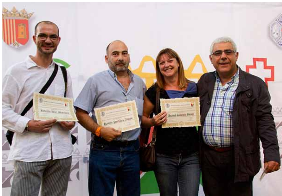
Los premiados del concurso, junto al presidente de Intercomparsas