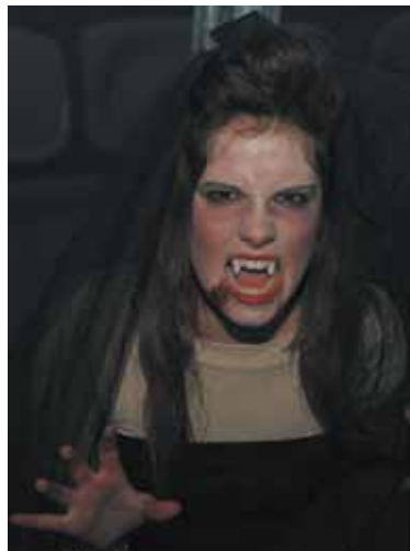
Vampiresa en la calle del terror PAD