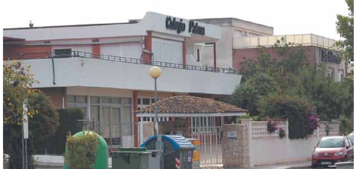
Imagen de la entrada del Colegio Palma

En todos los años que lleva presentando alumnos a bachillerato