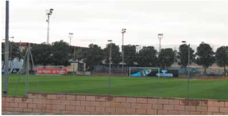
Imagen de la Ciudad Deportiva del Valencia C.F.

Por el momento, la modificación del PGOU no plantea ningún cambio en la zona de la Ciudad Deportiva, aunque no se descartar