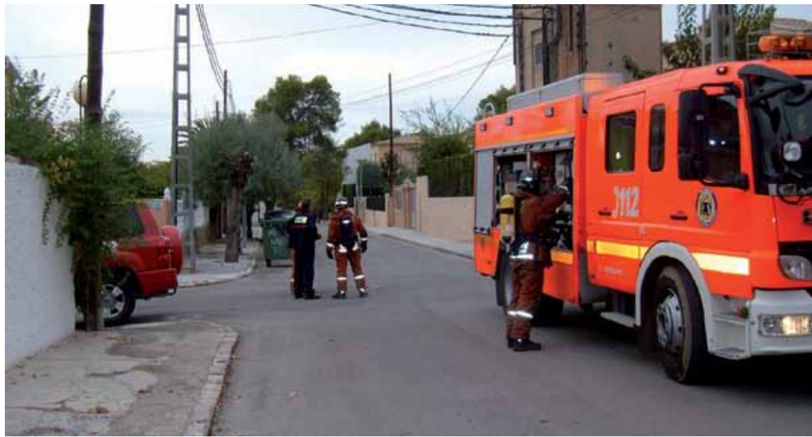
Un camión de bomberos entre las calles 11 y 14 donde se produjo la explosión del transformador

No es la primera vez que se produce una avería de Iberdrola en este punto, ya en marzo de este año se produjo otra, que hizo necesaria la sustitución del transformador, y unos pocos meses antes había también saltado uno de los fusibles del mismo transformador, lo que también dejó sin suministro durante bastante tiempo a los vecinos.