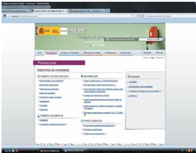
Captura de pantalla de la página web www.sepe.es PAD

A partir de ya en todas las oficinas valencianas del Servicio Público de Empleo Estatal no será posible pedir cita en la oficina