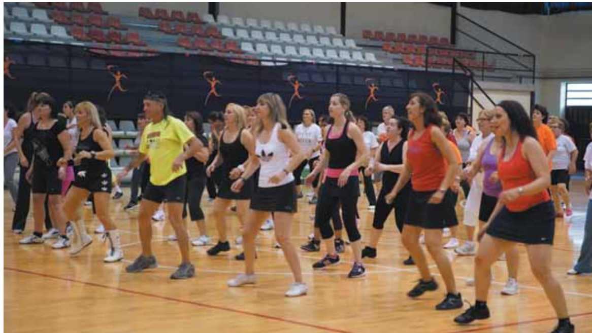
Una clase de aerobic en las actividades gratuitas de la quincena deportiva

Además de la subida de las tarifas de algunas de las actividades