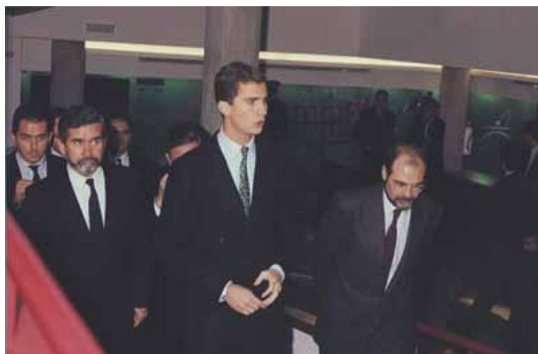
El Príncipe Felipe, junto a las demás autoridades, en 1990 P. Tecnológico

En sus inicios, sólo un número reducido de empresas se instalaron en el Parque Tecnológico, pero en la actualidad este espacio aloja a 450 empresas e instituciones, formadas por más de 8.000 trabajadores del sector Agroali-