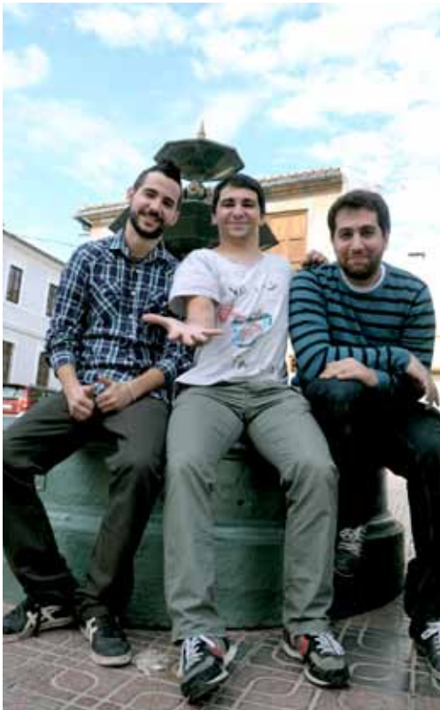
El grupo en la Replaceta

Influenciados por The Smiths, Michael Jackson y Bob Dylan, 'A poor chocobo' se inspira en la música de los 90. "Vemos nuestras canciones como una cápsula del tiempo del que puedan aprender las generaciones futuras", explican los componentes que añaden que sus canciones describen su entorno, vivencias e inquietudes.