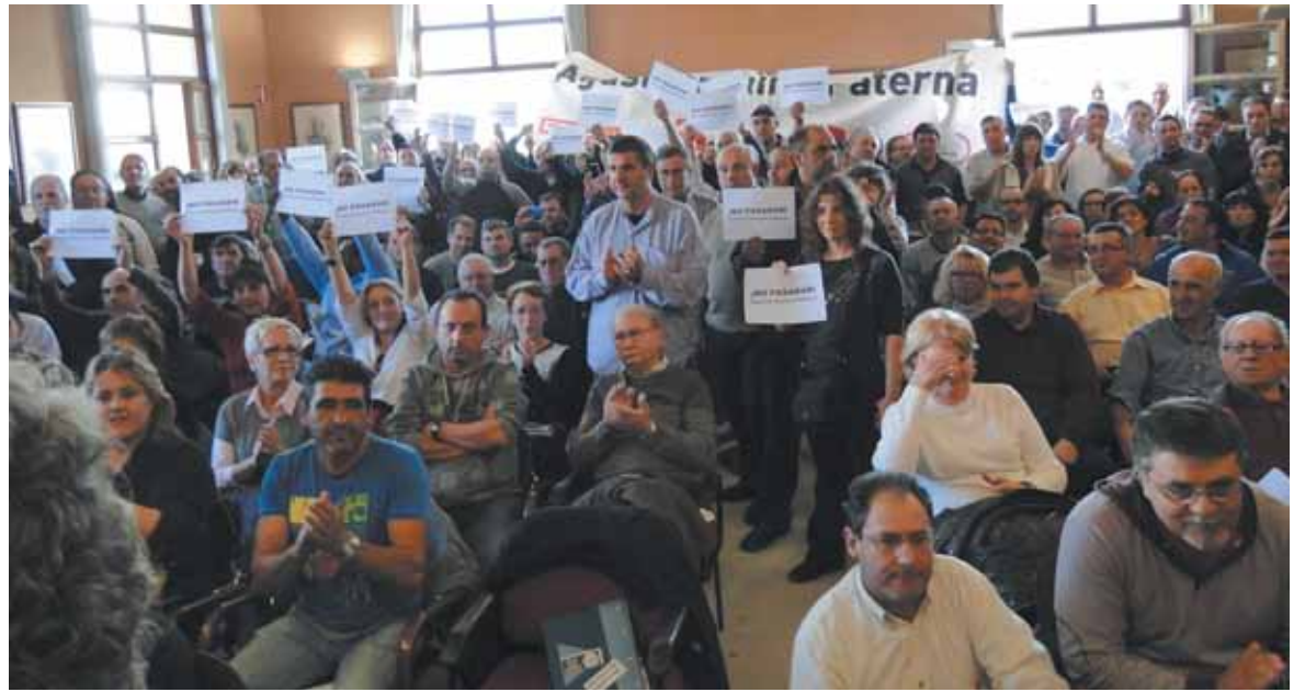
Trabajadores municipales mostrando sus pancartas al inicio del pleno municipal

Numerosos funcionarios se manifiestan frente al equipo de gobierno y hacen noche en el consistorio