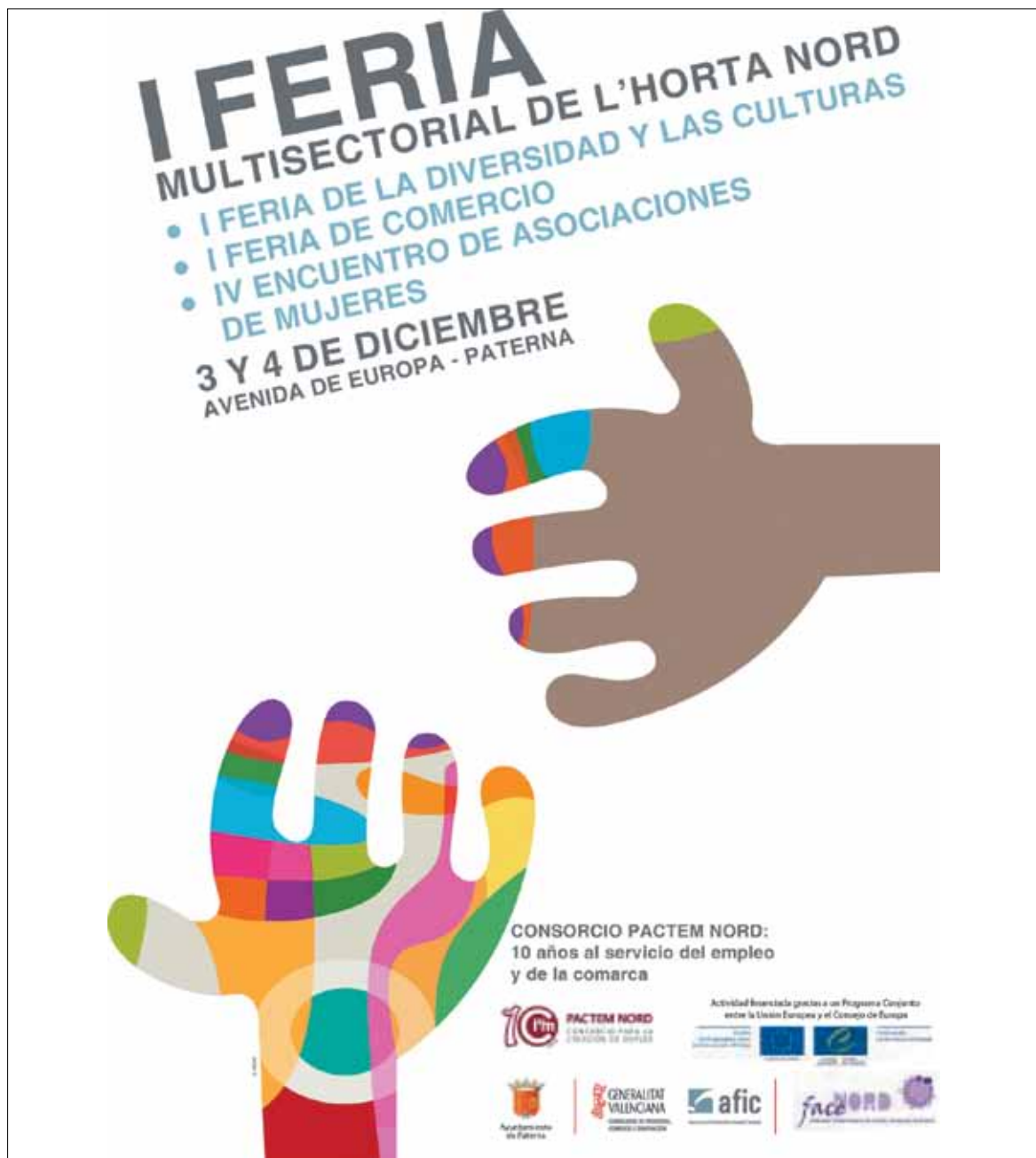
Cartel de la I Feria Multisectorial de L'horta Nord

Además, y como elemento innovador, se prevé dotar a la comarca de un servicio específico de transporte para facilitar la asistencia a los ciudadanos residentes en otros municipios de la comarca.