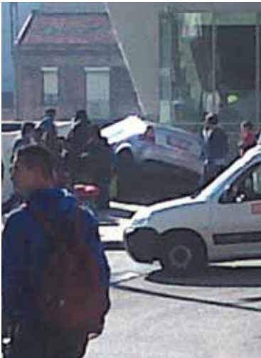
Al fondo, el coche empotrado

La rareza del accidente ha causado la sorpresa de muchos curiosos que se han acercado hasta la zona para ver lo que había ocurrido.