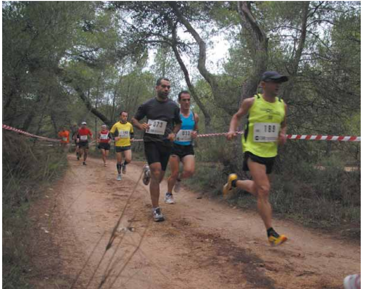
La carrera de bomberos a su paso por la Vallesa

gundos que encabezó una participación de 110 corredores de un total de veintisiete parques de bomberos. En la clasificación por equipos quedó primero el Aena Alacant por delante del wquipo de la UME y del parque de Sagunt. La organización quiere agradecer a todos los colaboradores que año tras año les apoyan y a los bomberos del parque de Paterna que hacen que la carrera sea posible.