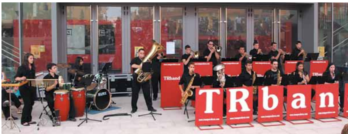
La TR Band en una de sus actuaciones a las puertas del auditorio