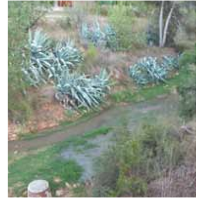
Aguas fecales en el barranco PAD

Vecinos de La Canyada han mostrado sus quejas por la acumulación de aguas fecales que se produce en el barranco de la Font, en la parte que no está urbanizada. Según sus denuncias, aunque ahora se encuentra limpio, con frecuencia se producen desbordamientos de una de las grandes tuberías de La Canyada que pasa por la zona. “A mediados de noviembre es la última vez que ha estado inundado durante dos semanas. Pasa con relativa frecuencia y la zona está muy descuidada”, destacan los vecinos.