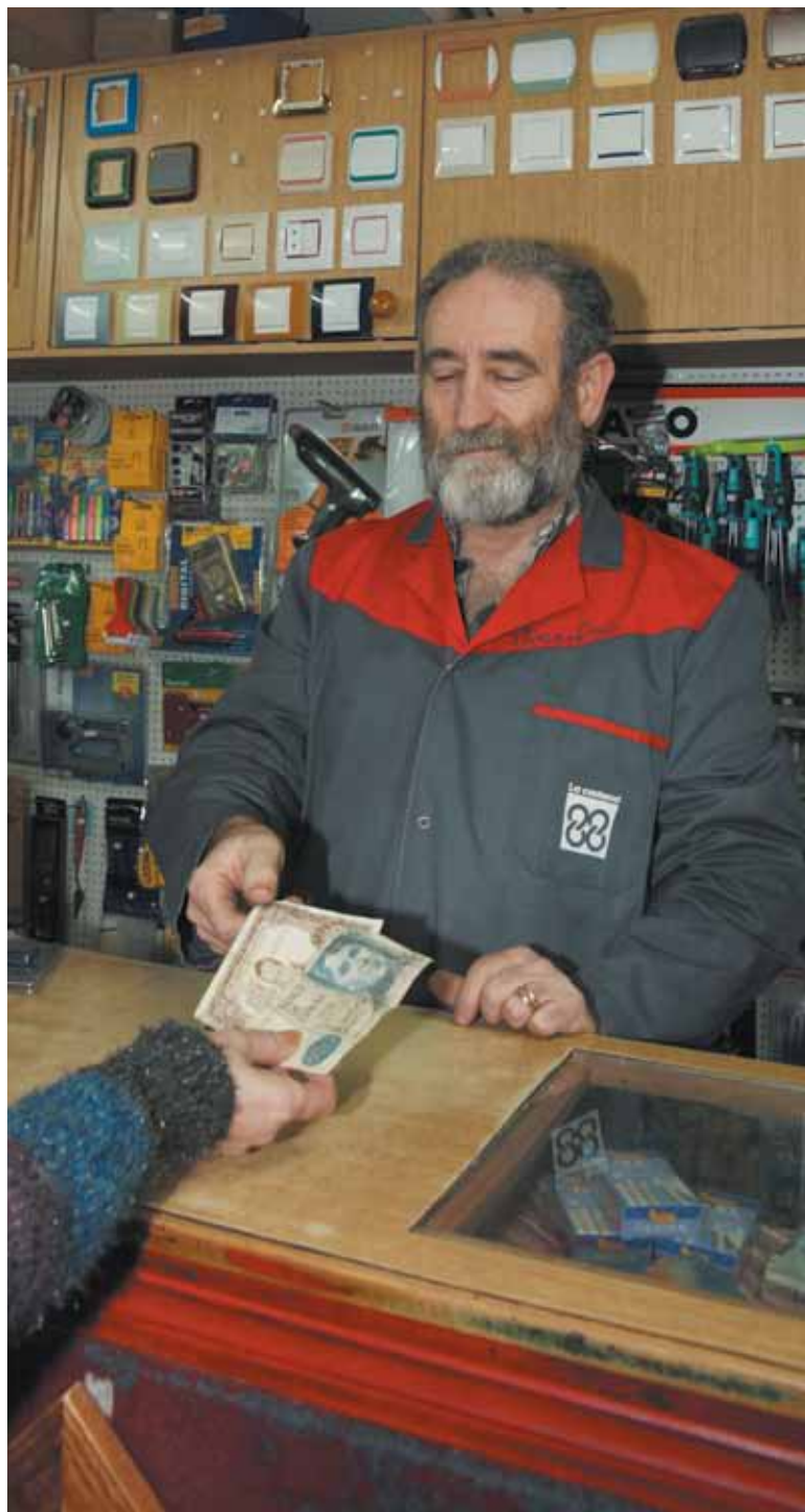
Comprando con antiguas pesetas

Una manera para que se mueva un dinero que lleva más de diez años parado en casa y a su vez ayude a reactivar el comercio local. Además, será también una oportunidad para poder enseñar a los más pequeños cuál era la moneda que se utilizaba para realizar las compras antes de que llegara el euro.