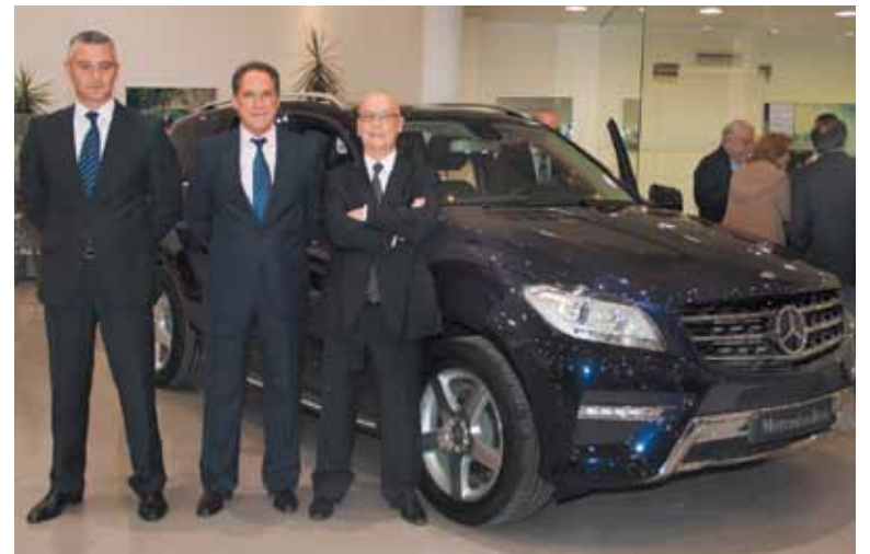
El nuevo clase M en su presentación

A la presentación se completó con la exposición que la Joyería de Antonio Romero puso a disposición de todos los invitados, con piezas que complementaban a la perfección con la elegancia que la marca Alemana imprime a sus vehículos. Además Schweppes volvió a formar parte de la presentación.