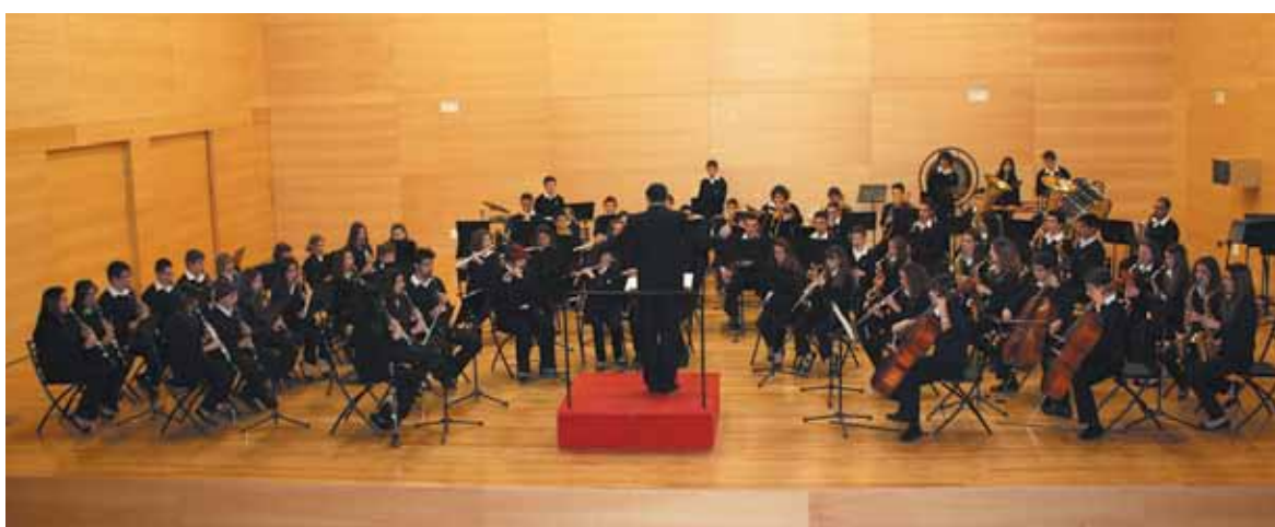
La Banda Juvenil durante el concierto

El Centro Musical Paternense homenajea la festividad de su patrona con conciertos de todas sus formaciones