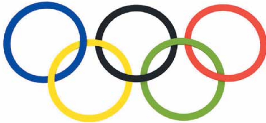
Los aros que simbolizan los cinco continentes que participan en los Juegos Olímpicos

“La intención es que no sólo se trabajen los aspectos propios de la Educación Física, sino que se puedan trabajar interdisciplinariamente objetivos de todas las áreas