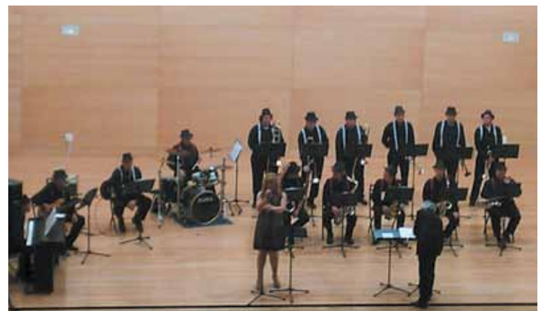
La Big Band