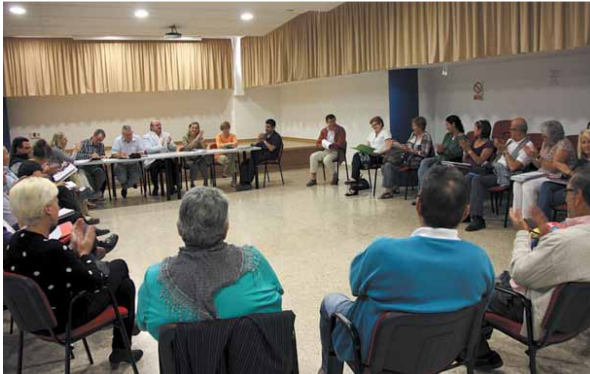
Imagen de la comisión que tuvo lugar en el barrio de La Coma

Por otro lado, la Fundación acaba de solicitar también las ayudas para desempleados preceptores de ayudas al desempleo (Motiva't) destinadas a favorecer