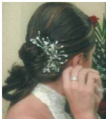
Recogido de novia