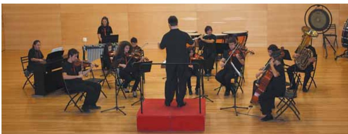
La Joven Orquesta