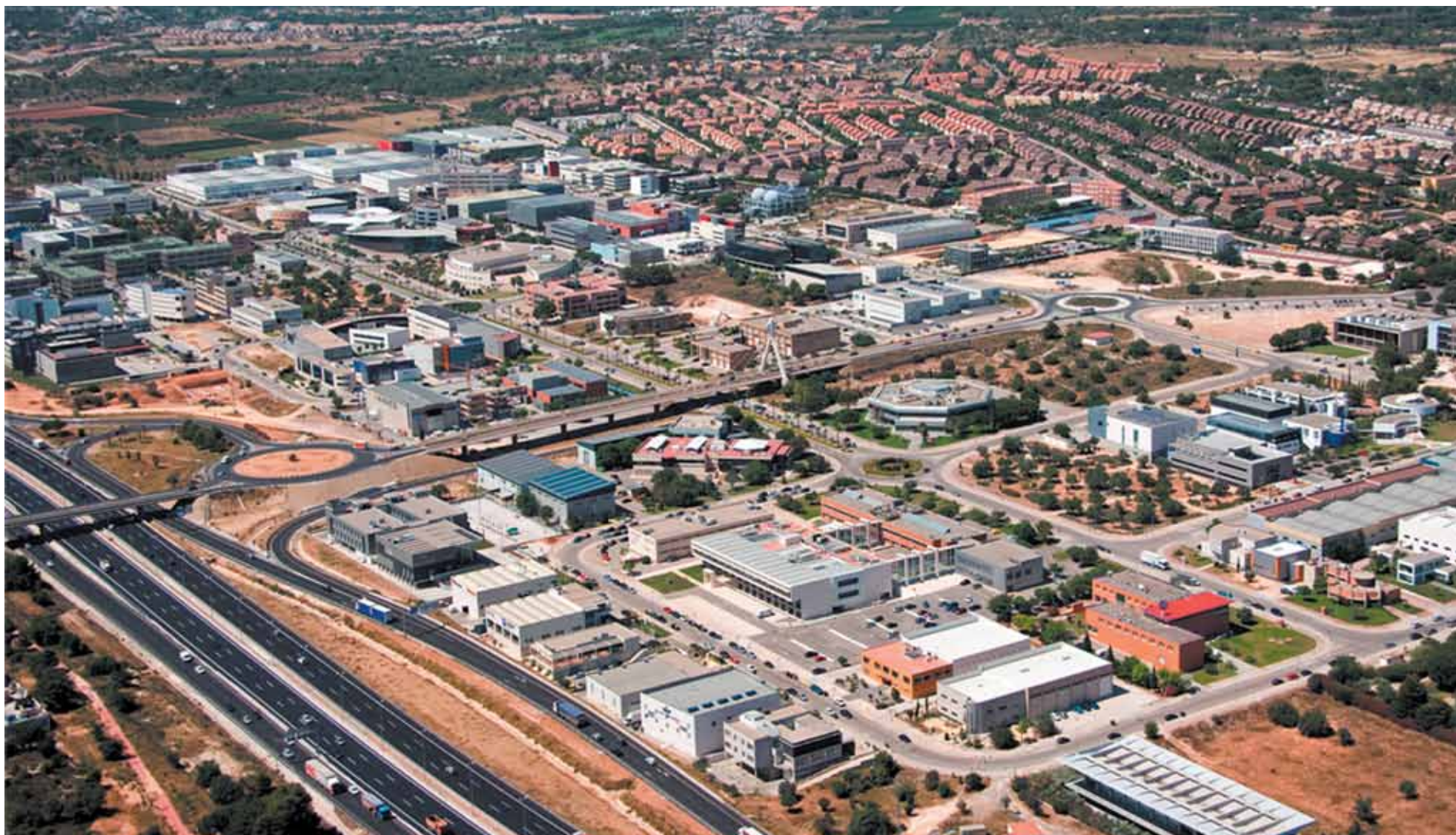
Imagen aérea del Parque Tecnológico, un enclave que destaca por sus empresas innovadoras y tecnológicas