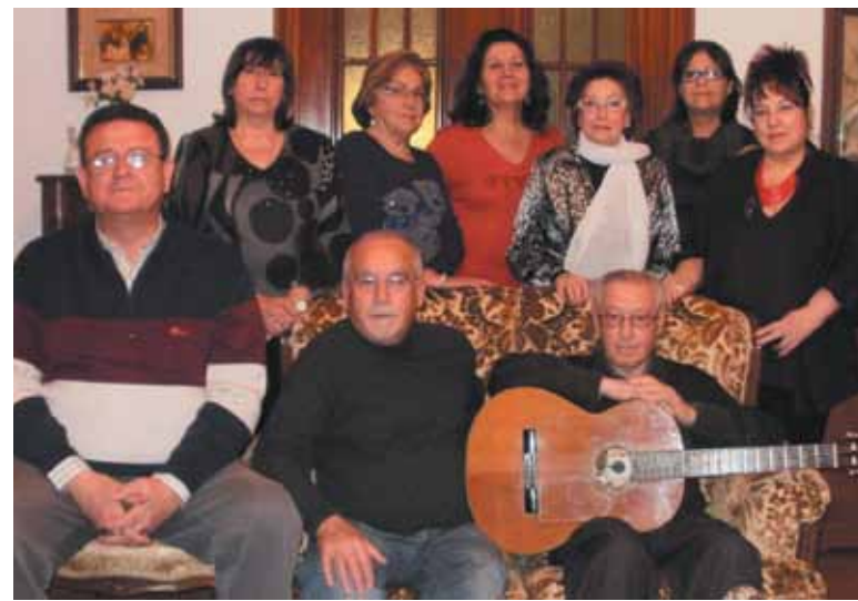
Miembros del grupo de Enamorados de la Música y la Poesía PAD

Al finalizar el acto del día 9 de diciembre se ofrecerá un refrigerio y el objetivo es repetir la actividad mensualmente.