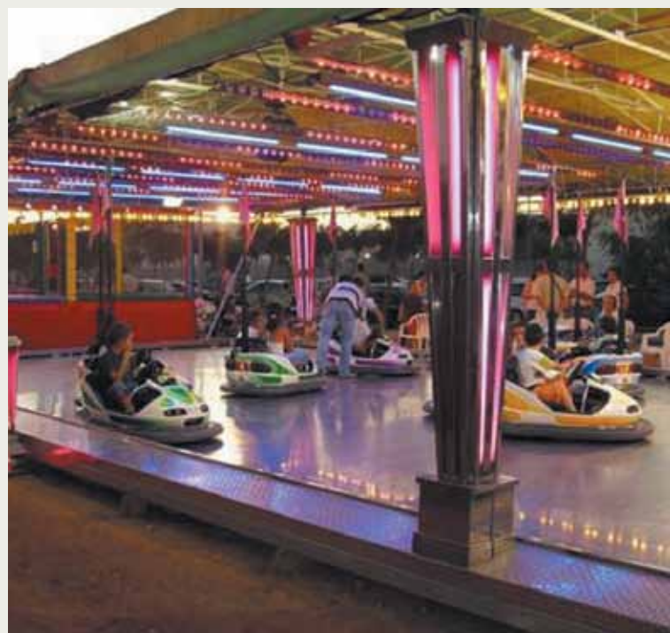
La feria de atracciones se instalará en el Parque Central