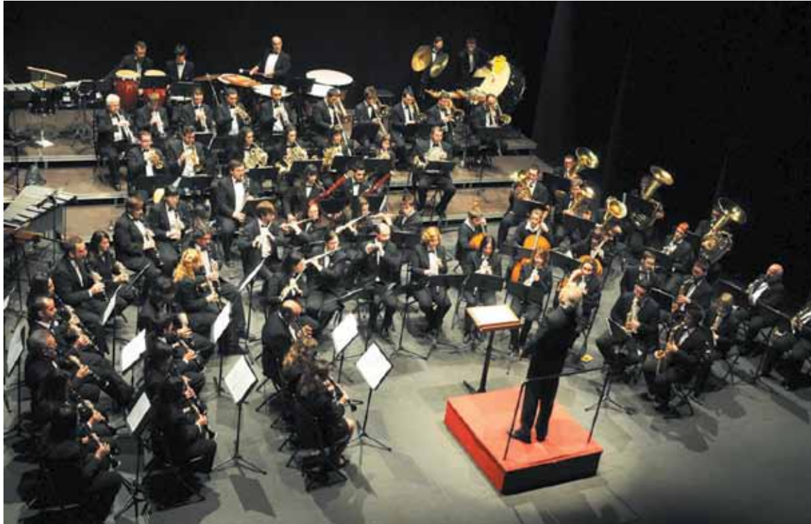
Banda Sinfónica del Centro Musical Paternense