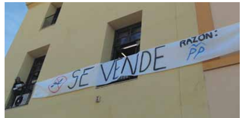
Cartel que colgaba de los balcones de la oposición