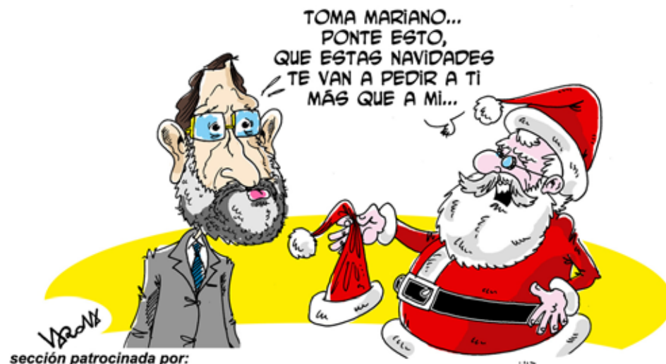
sección patrocinada por: