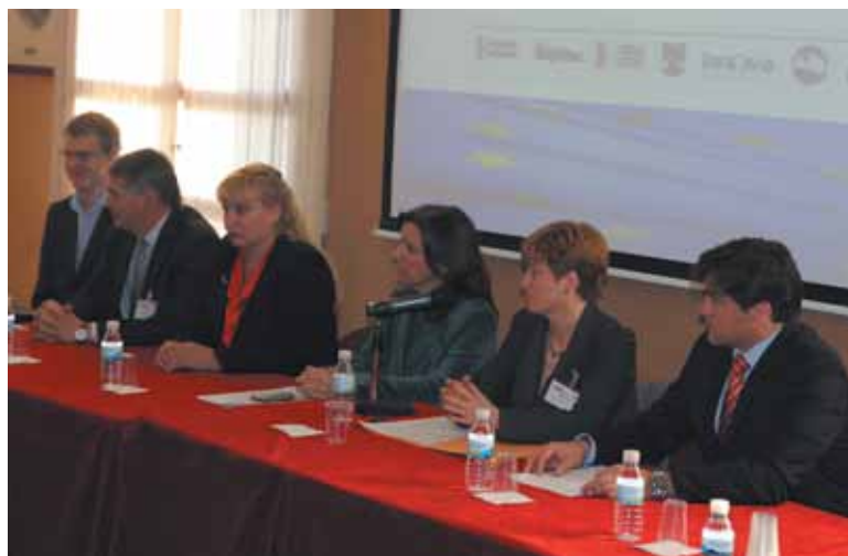
Imagen de la firma del acuerdo en el salón de plenos

Fomentar la transferencia de tecnología entre pymes de los distintos territorios, centros de investigación y universidades ubicados en ellos, es otro de los beneficios que puede traer a Paterna este acuerdo, según indican fuentes municipales.